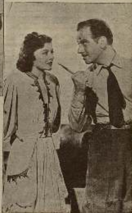
No está en su finco criando corditos, aunque como granjero aristócrata se le ve en La vuelta de Arsenio Lupin .

se. Todavía no estaba yo en situación de poder elegir dama, como la Cahagan estaba en la de elegir galán.