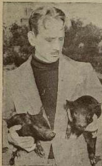
En la nueva producción Yo soy su marido, Melvyn Douglas realiza una creación cómica que nada tiene que envidiar a las de William Powell, según opinión de Myrna Loy.