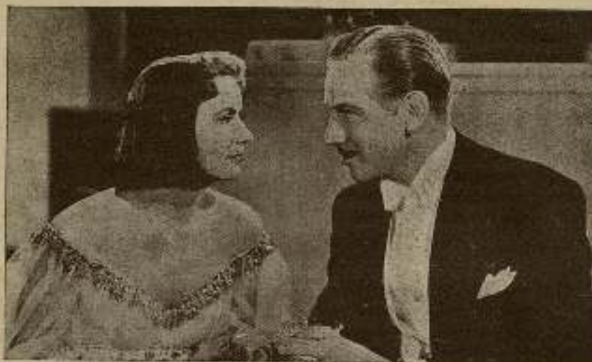
En Ninotchka , Melvyn Douglas es, tal vez, donde ha conseguido uno de sus más señalados éxitos, disputando el triunfo a la propia Greta Garbo.