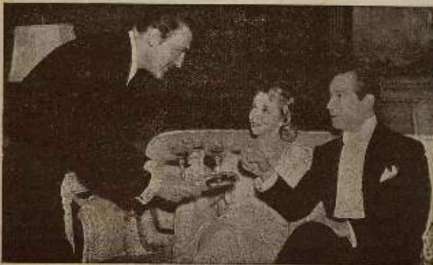
Sentado junto a Virginia Bruce, desafía a Warren William en La vuelta de Arsento Lupin.