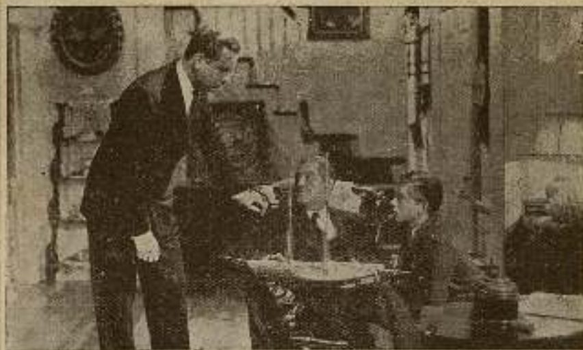
Un papel discreto y sabido lo fué reservado en Capitanes Intrépidos , donde se codea con Lionel Barrimore, Spencer Tracy y el precoz Freddie Bartholomew.