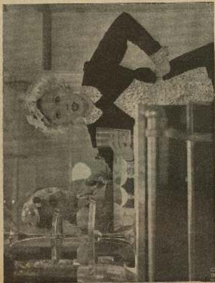
Se dispuso a servirle un brebaje, destinado, sin duda, a envenenarle.

Intentativa salieron tan mal parados, que a punto estuvieron de hacer las maletas y largarse renunciando a sus propósitos.