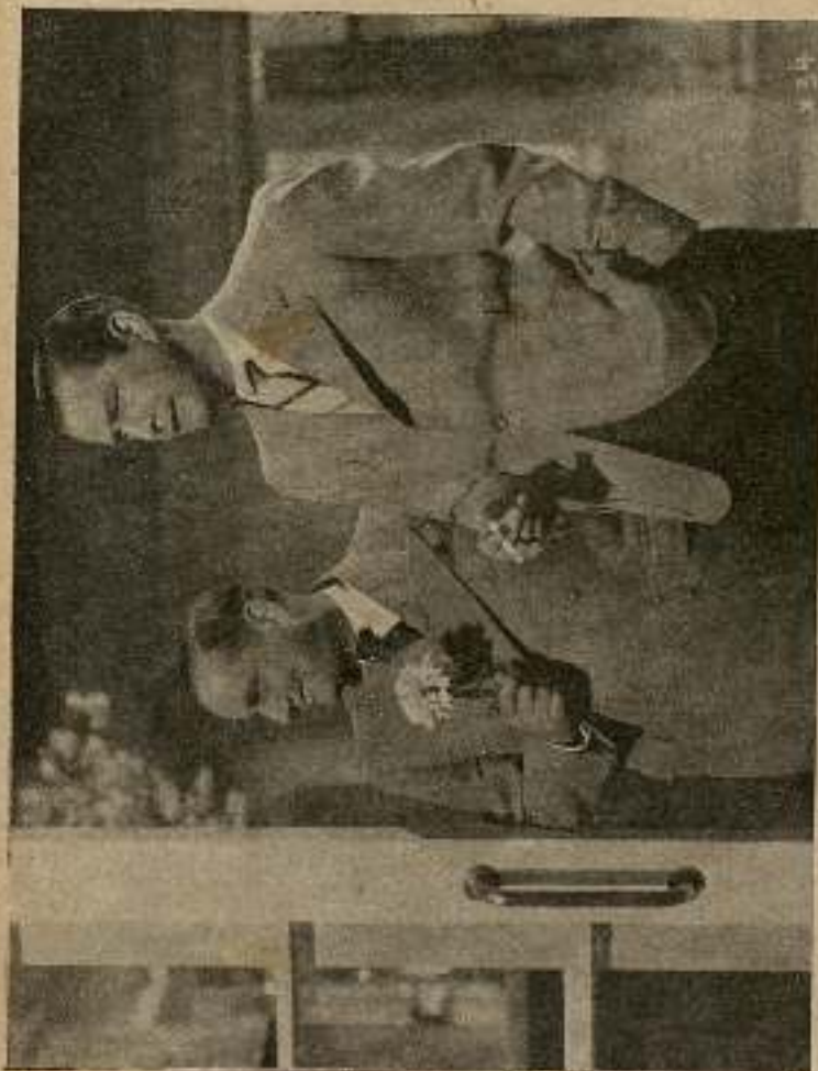
Juan y su amigo bajaron al comedor, en donde...

La clientela se había ido acercando a la mesa formando corro alrededor del grupo de los que discutían. Todos habían tomado el partido de la gentil camarera, y esto daba fuerzas a la vieja para gritar cada vez más contra los don Juanes de profesión, quienes iban, los pobrecitos, perdiendo terreno en todos los sentidos, ya que poco a poco habían ido retrocediendo hasta llegar a la puerta, perseguidos por su implacable acusadora, que seguía gritándoles su desprecio. De aquella primera