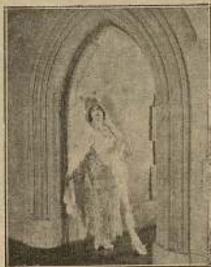
Apareció vestida de andaluz...