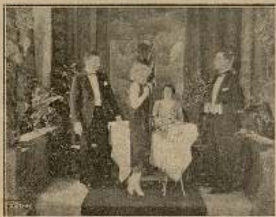
Bruce la miró, cautivado...

La conversación se generalizó. Lecoínte hablaba con la norteamericana, y Bruce no podía apartar los ojos de Gaby.