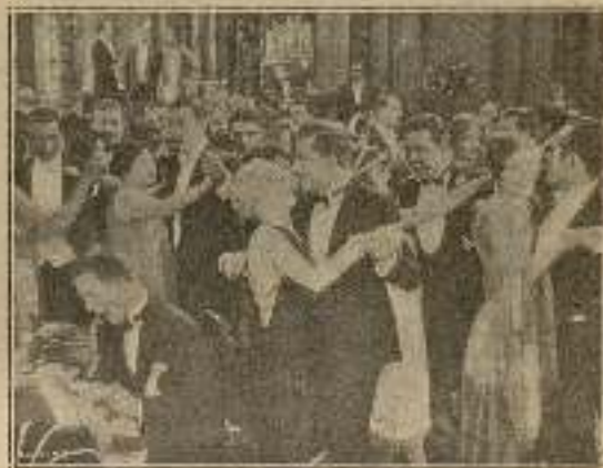
...bailó con Gaby una danza de lánguidas notas...

El prefecto Lecoq sabía llegar siempre en el momento oportuno. Entraba en el "cabaret" en el instante en que su amigo se dispo-