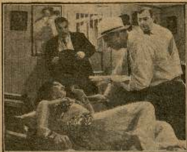
— ¡Siéntate aquí! — le dijo a su novia.

la noche y hacerlo público para que sea conocido de todos ustedes.