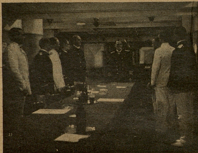
- La entrada al puerto es muy angosta. .

Las hazañas del Emden empezaron ya a hacerse célebres y todo el mundo hablaba de aquel buque como si hablasen de un fantasma. Se aparecía donde menos se le esperaba y su comandante se había dado tal maña en desfigurar a su buque, que casi nunca tenía el mismo aspecto. Unas veces aparecía con tres chimeneas, otras con dos y hasta con una, haciendo imposible la identificación desde lejos del barco.