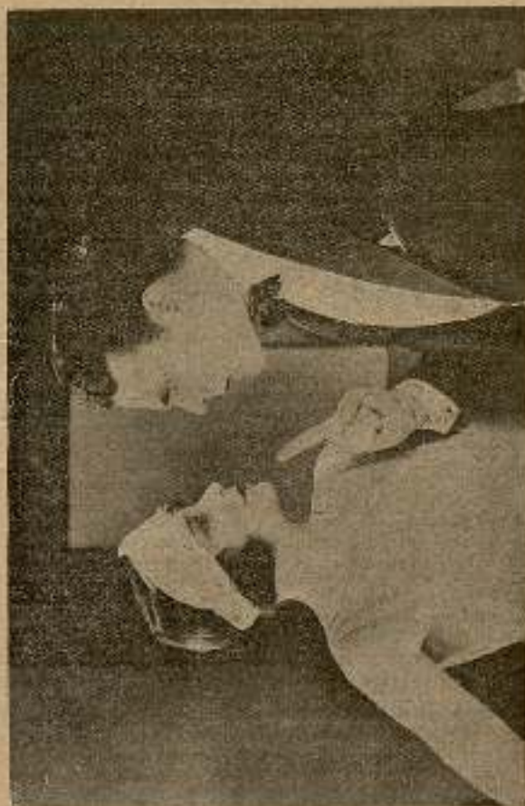
Este es de los colores (pág. 22).

El guasón tomó en serio la contestación de la joven y un momento después se presentó ante el establecimiento, la brigada del servicio de