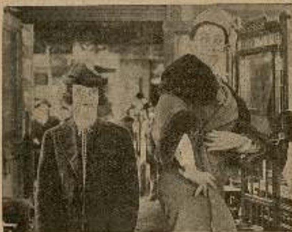
Habitantes de Acción

— ¡Ay!... Dispénsame, caballero... He perdido el equilibrio.