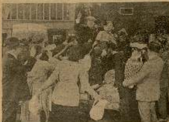
Señoras y señores. (pág. 20).

En estos pensamientos estaba cuando llegó Israel Hubbard. Era un hombre que pasaba