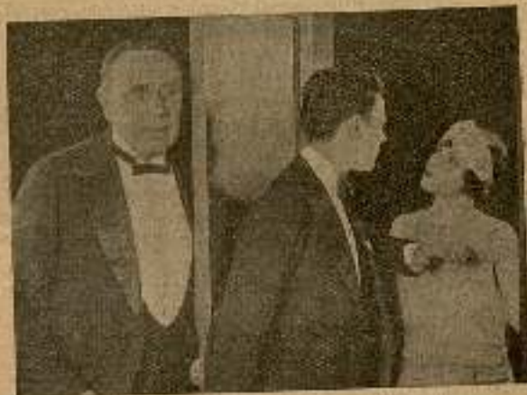
...y entró tras de la puerta (pág. 201).

—¡Ah!... ¡Fuera de aquí!... ¿Qué es habéis creído? ¿Que mi casa es un teatro de títeres?... ¡Fuera, fuera!