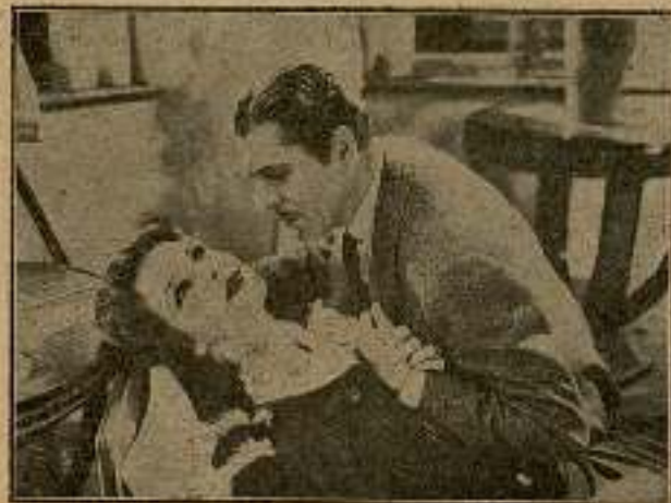
...Vicki repuso al amor con amor...

No, aunque en un momento de obsesión ella creyera lo contrario, aquel amor que ella pretendía resucitar al recor-