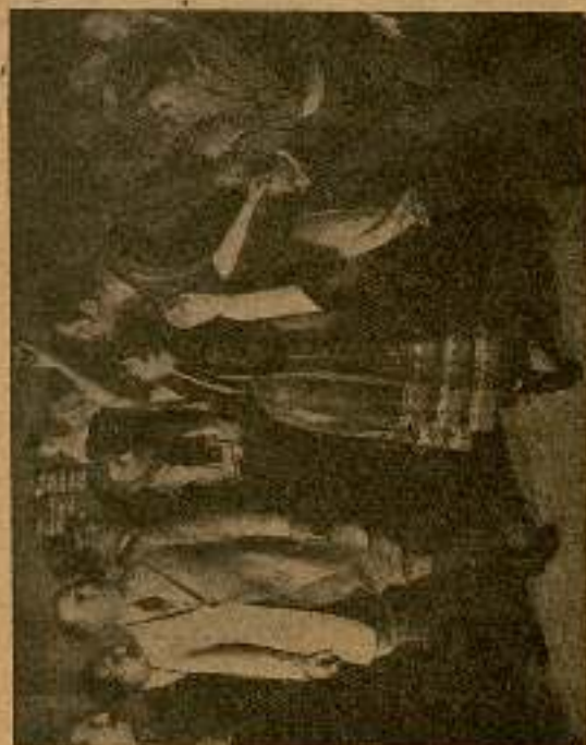
— Arreco había venido para matar a un hombre.

Al salir el ex presidiario, de tan extraña manera del palacio de Bargas, volvió de nuevo