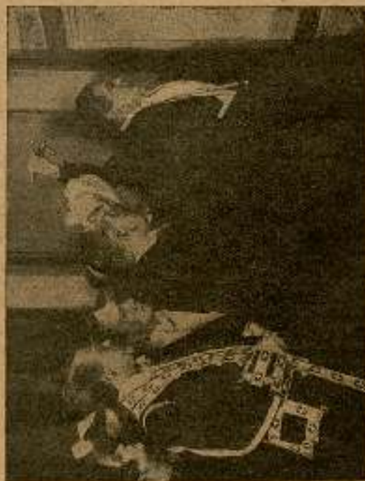
Mientras, los persecutores golpeaban la puerta.

Inté se mostró dispuesto a todo, dirigiéndose con su prima a la mina. Parkas, que cada día visitaba la tumba de su esposa, los vio llegar, ocultándose para no ser visto.