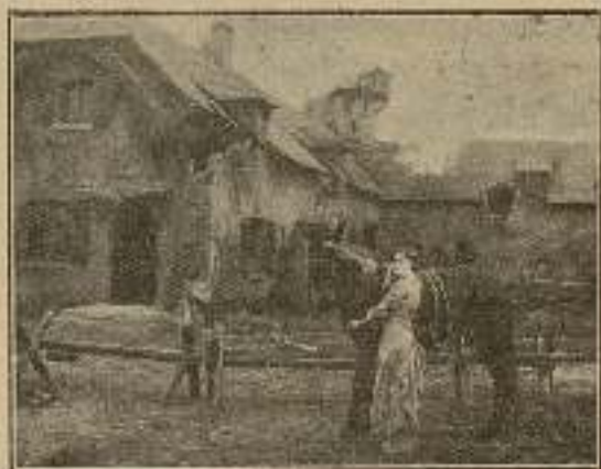
Magdalena, triste y abandonada en medio de tanta desolación...

—¿Una medalla?—respondió el otro—. ¿Cómo van a dar una medalla al mundo en-