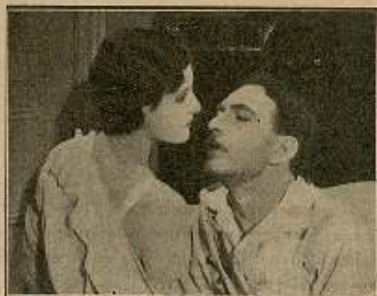
La vió destollecir bajo sus caricias...

Los barones d'Archeville acababan de des-