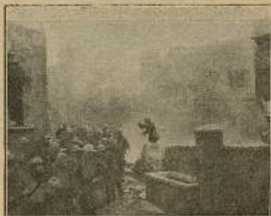
Carlos Stone, en medio de la plaza, dirige a la multitud...

cheville, convertida en cuartel, las tropas se aprestaban a la lucha.