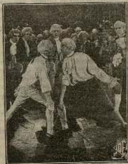
Reanudose el duelo, esta vez sangriento...

Sir Percy vio como nadie el dolor que experimentaba Déroulède por la involuntaria muerte que causara al vizconde de Marry.