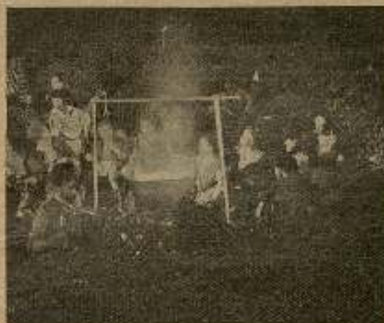
—Arrojan una granada de mano.

—No podremos entrar esta noche en la ciudad—les dijo Sacha—. Ya habrán advertido la fuga y estarán todos los caminos vigilados.