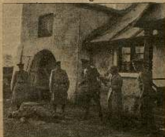
—Disparó sobre él haciéndolo morir instantáneamente.

Pero entre todas las pruebas de egoísmo que había podido ver en sus amistades y parientes, ninguna hacía tanto daño en el corazón de Víctor como el abandono de Natalia. Jamás hubiera llegado a creer que ella