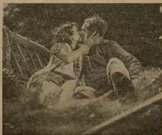
Entre el vino y las caricias de ella...

Natalia ocultó en la habitación de al lado al ordenanza, mientras hablaba con Wronkoff, a quien le dijo, apenas entró.