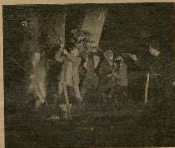
...poco después condujeron a la cueva a los bandidos.

Tomks oía a la joven y los celos se apoderaban de él con la desesperación que produce lo imposible. Y mientras que los gitanos, poseídos del contento de haber realizado una de sus mejores hazañas, se divertían, en la ciudad los robados daban cuenta al co-