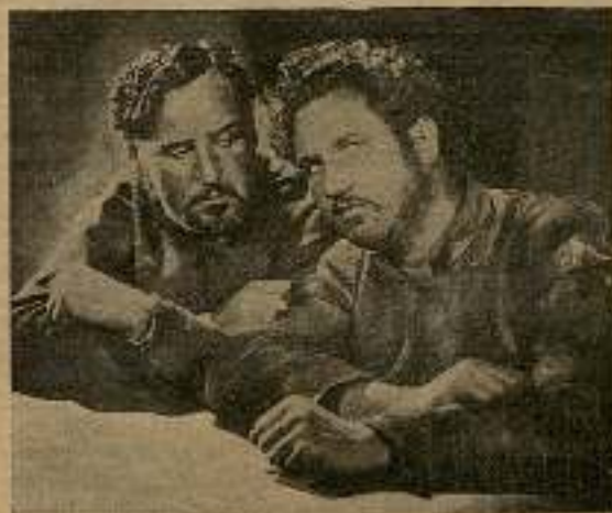
Si supieras las cosas que se hacen cuando se está enamorado.

Saló afuera de la casa y, cuadrándose militarmente ante el coronel, esperó a que éste le hablara. Toda la ira, todo el odio que encerraba el alma del tutor de Natalia se concentraron en la mirada que éste dirigió al príncipe, hasta que, finalmente, mordiendo las frases, le dijo: