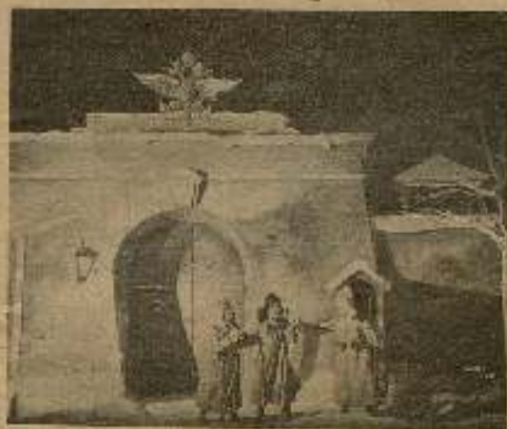
... los señores salieron a su encuentro.