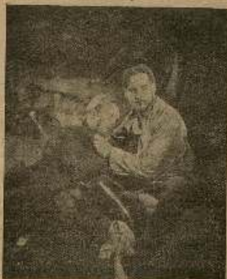
—He sido un miserable...

—Esa mujer es su esposa, Basilio. La esposa del hombre que te sacó del presidio.