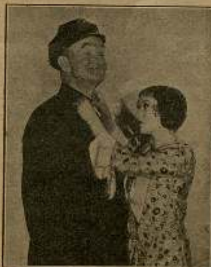
Cuando papá Ford llegó a casa...

Lo que ella no se atrevía a pensar, se lo