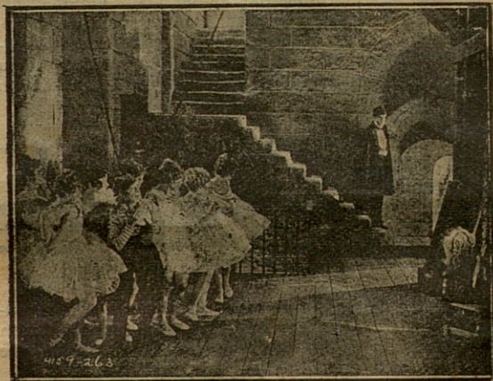
Sus miradas se cruzaron con las de un hombre de aspecto poco tranquilizador.

En aquel momento se oyeron pasos en la escalera que conducía al foso donde se encontraban las bailarinas y el tramoyista. Se hicieron todos a un lado y miraron hacia la serie de peldaños. Sus miradas se cruzaron con las de un hombre de aspecto poco tranquilizador, alto, vestido de frac, una capa sobre sus hombros y un gorro en la cabeza. Le llamaban el Persa. Se le veía a menudo por los fosos.