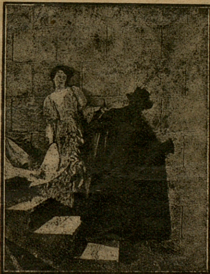
Cristina no apartaba su vista del rostro del Fantasma, y obedecía maquinalmente...

—Yo quisiera explicarte, dando a mis palabras