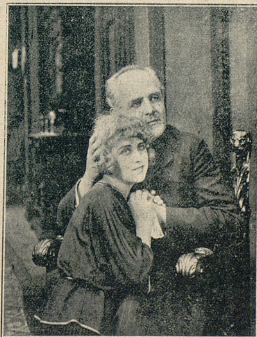
Escena de la hermosa película en series «La Esclava Blanca», por Evi Eva y Willi Kaiser-Heyl

—...Y no olvidéis, princesa, que quien llega a poseer los favores de la hija del rey ha de desaparecer de entre los vivos.