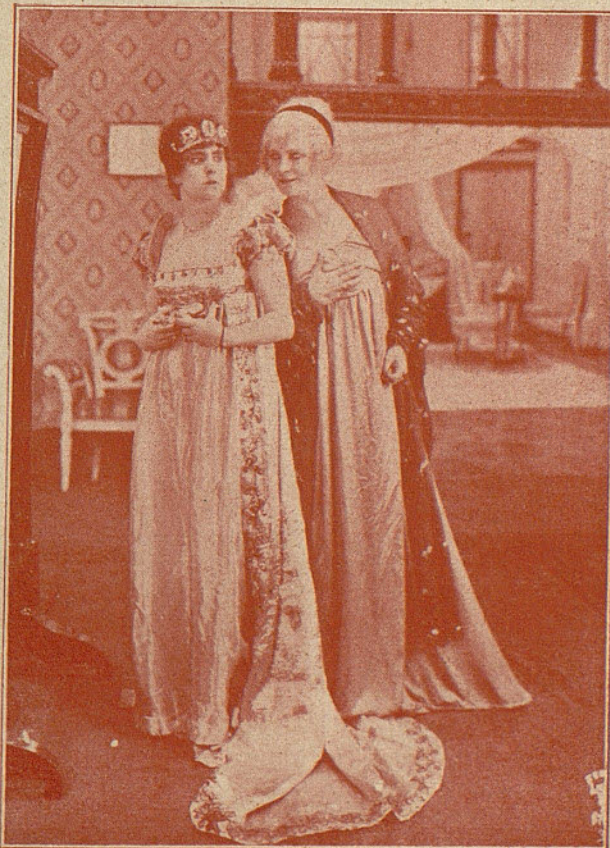
Preciosa escena de la película "La Condesa Walenska", de la casa "Radium Films".