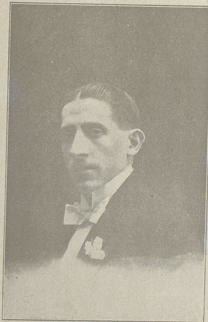
RAFAEL DÍAZ NOTABLE ACTOR CÓMICO

En este número publicamos el cuplé «Coledonio, ¿qué te pasa?», creación de Preciosilla.