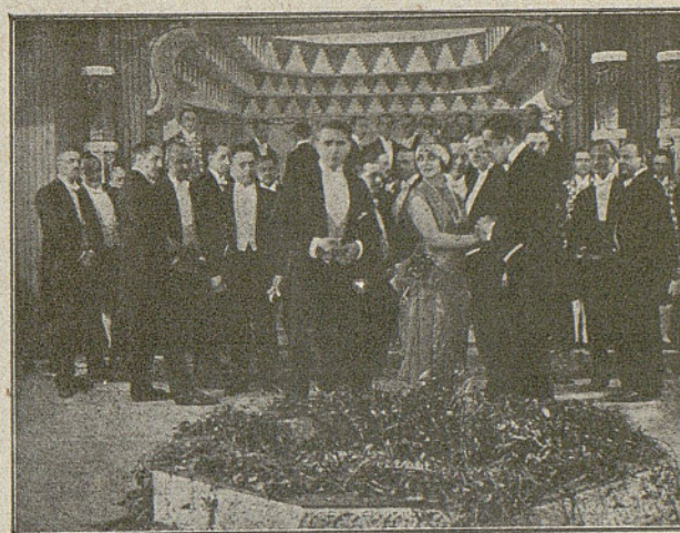
Una escena de la interesante película cómica dramática «Vida de artista», exclusiva de Radium films y que se pasará el 16 de Enero próximo

Cerróse la puerta y el falso proteccionista comenzó su labor práctico-persuasiva sobre la desertora del taller o de la cocina. No había de costarle gran trabajo rendir a