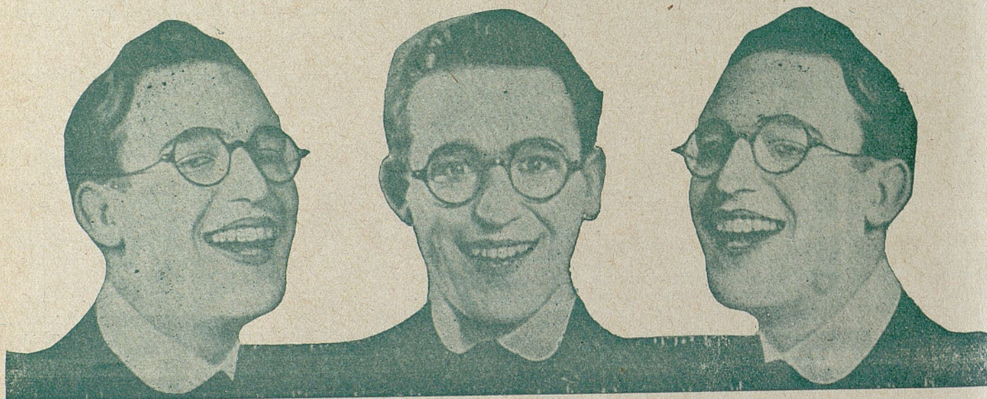
El notabilísimo actor cinematográfico HAROL LLOYD