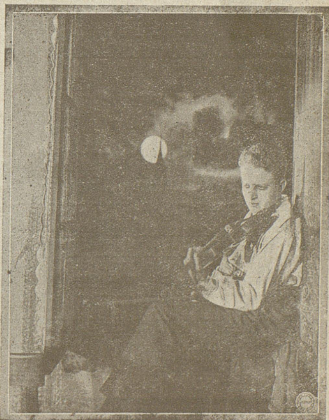
Una escena del gran film «El Pensador» editado por la casa Gaumont