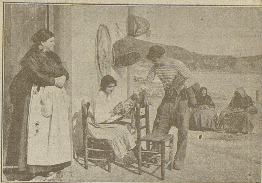
Una escena de la interesante película «El Expósito»

Sin que ni por asomo nuestro comentario sobre esta película obedezca a motivo alguno de propaganda, ya que comercialmente no nos importa lo más mínimo, queremos explicar algo de ella, por tratarse, como queda manifestado en artículos anteriores, de una producción española y hasta, mejor dicho, catalana, por su argumento, su estilo y sus paisajes.