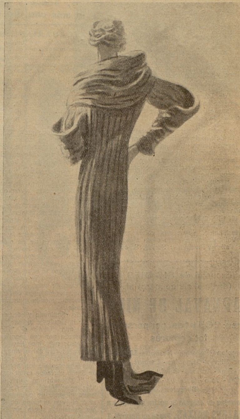
Abrigo de crisú natural

* PUERTAFERRISA, NUMS. 7 Y 9 . BARCELONA *