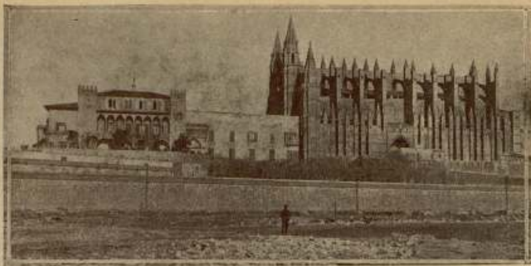
Palma de Mallorca.—La Catedral y La Almudaina