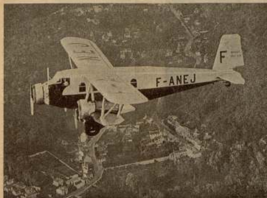
Avión de la Compañía «Air France» volando por encima de los alrededores de París

Las carreteras, vías férreas, canales, parecen tejer sobre la naturaleza una red de servidumbre, fibras innumerables por medio de las cuales se realiza la continuidad de este ser compuesto.