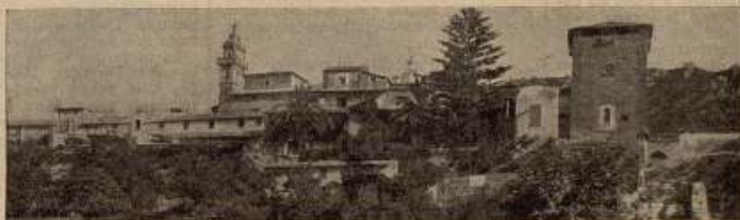
MALLORCA. — La Torre de Valldemosa.