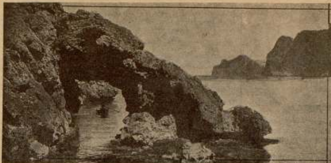
Mallorca. La Foradada