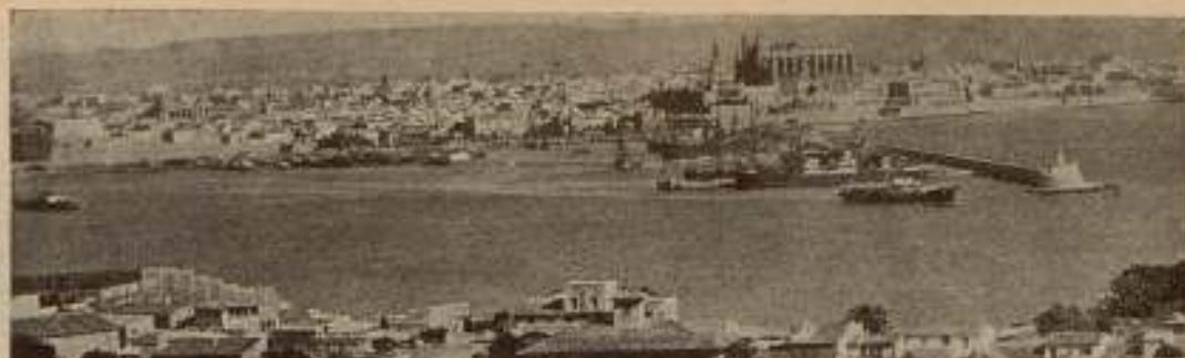
PALMA DE MALLORCA. — El puerto y la ciudad vistos desde Porto Pi.