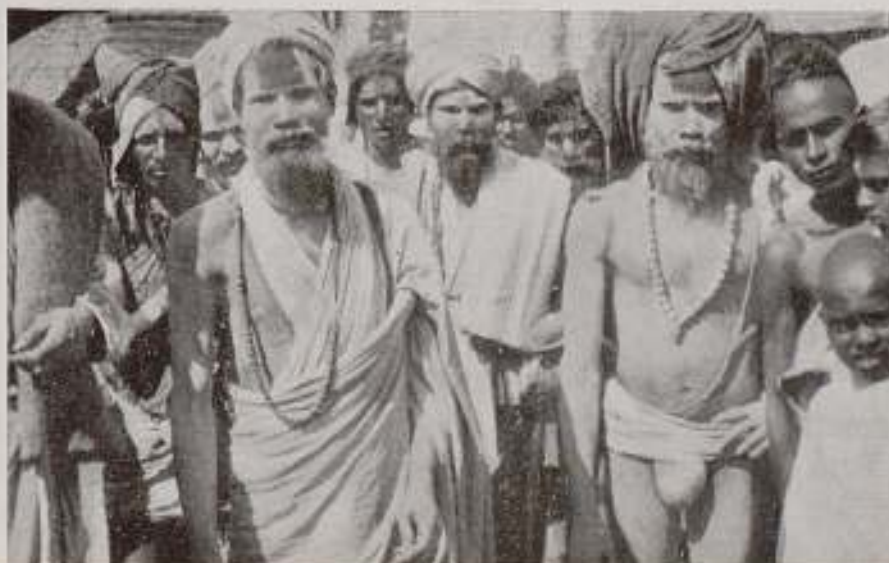
«Los Sadhus, monjes mendicantes». Documental Ufa.

Hace aproximadamente dos años, Robert Flaherty y Dudley Murphy, que conocen el interés que siento por el cine y los estudios que tengo hechos