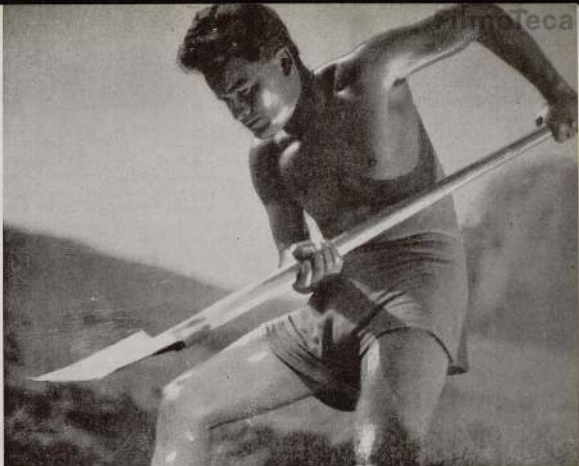
"La tierra tiene sed", film soviético de Raismann, que se proyecta actualmente en París.

cientos de kilómetros de distancia y si no hubiese sufrido ese sabotaje que las empresas burguesas de librería tienen organizado para las revistas revolucionarias e independientes de toda concomitancia financiera.