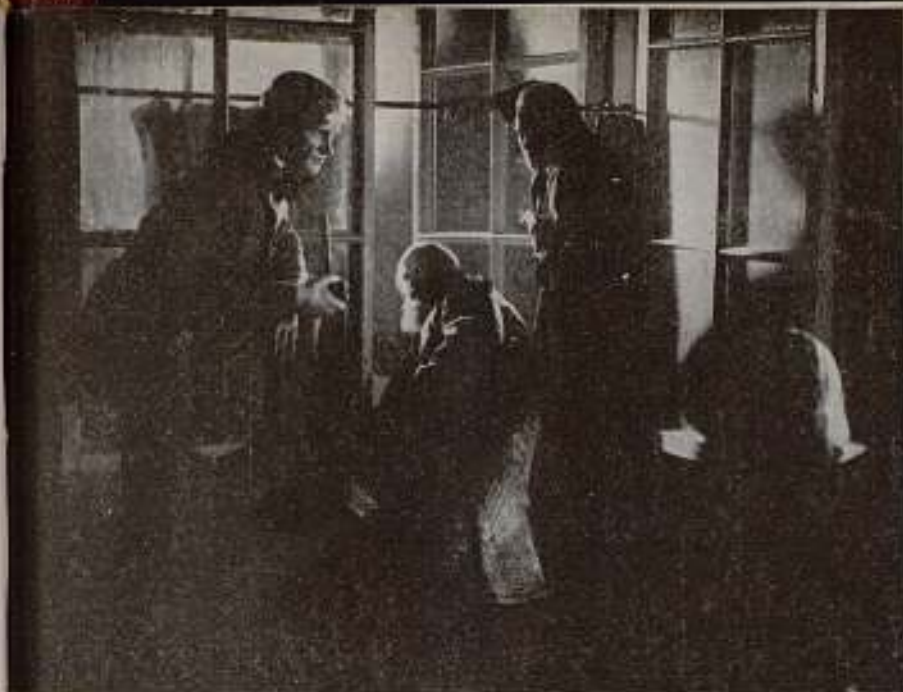
Una reunión política clandestina. «Dostoiéwsky», film soviético de Fedorov.

denuncia y les entrega a la policía. El general de la policía, amigo de la familia de Dostoiéwsky, tiene con él unos diálogos: «¿Cómo tú, un gentilhombre, ha podido venir al socialismo?» «Yo no soy socialista, pero sueño con un mundo mejor y creo que de la idea socialista puede salir algo fuerte, algo así como la química al salir de la alquimia.» El general se ríe y pronuncia esta simple frase: «No habrá nunca un socialismo científico.» Y luego: «Usted cree llegar al pueblo, pero el pueblo está lejos de usted... Usted vendrá a nosotros porque no puede escapársenos... psicológicamente, no puede hacerlo...»