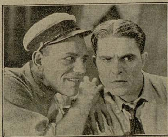
Marcos trató de sobornar a Julio pintándole la holganza en que vivirían...

—Descuida que no le hablaré. Buenas noches... y que tengas un feliz sueño.