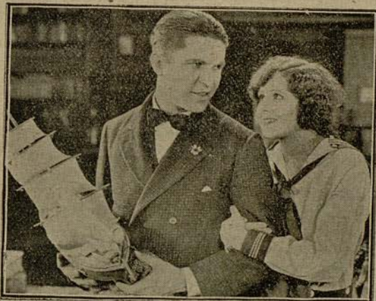
Julio depositó el barquito sobre una mesita...

—Este libro lo empezó mi padre hace años—le manifestó a Priscila—. Escucha la lectura de algunos de los manuscritos honrosos que encierran estas páginas amarillentas: