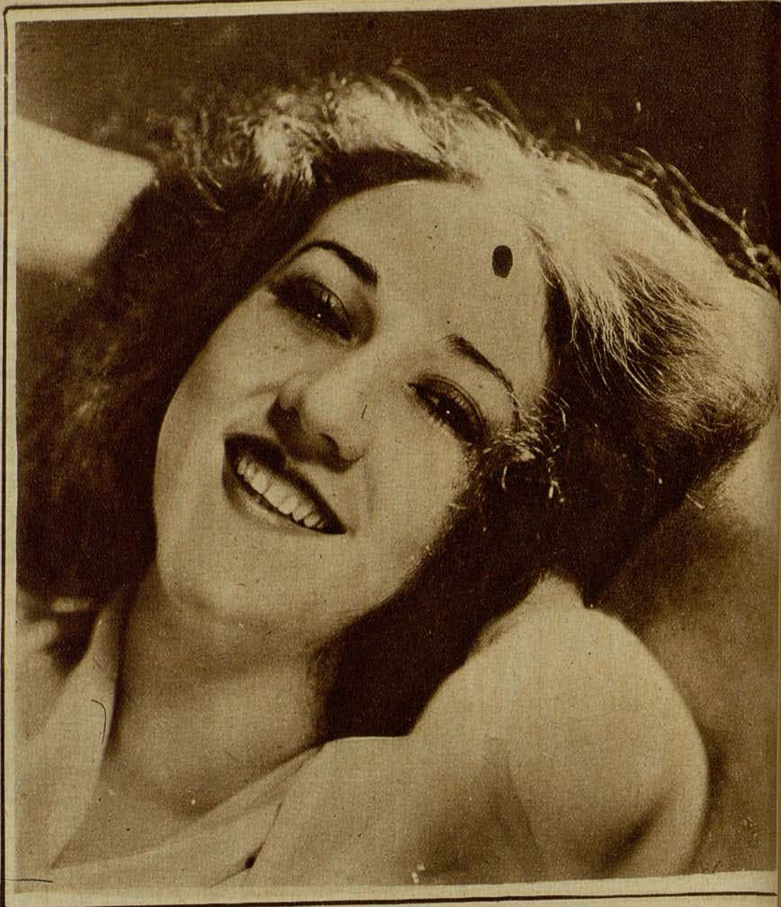
Maria Fernanda Ladrón de Guevara

—«La Mujer X», «El proceso de Mary Dugan» y «Oherly Biby».