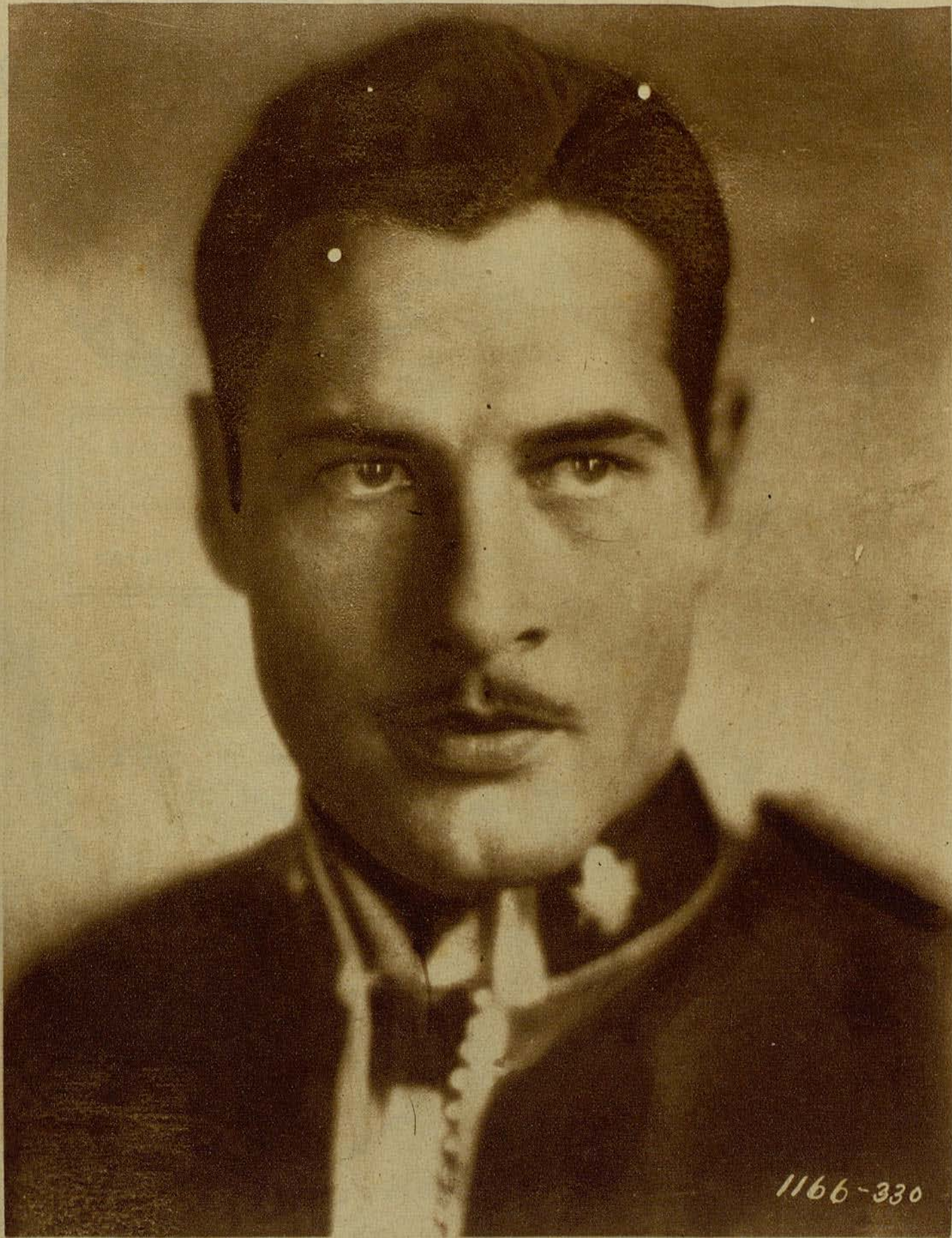
El famoso actor de la Paramount, Richard Arlen