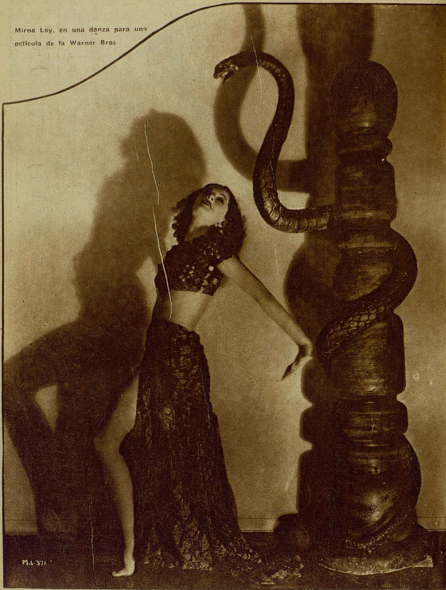
Mirna Loy, en una danza para una película de la Warner Bros