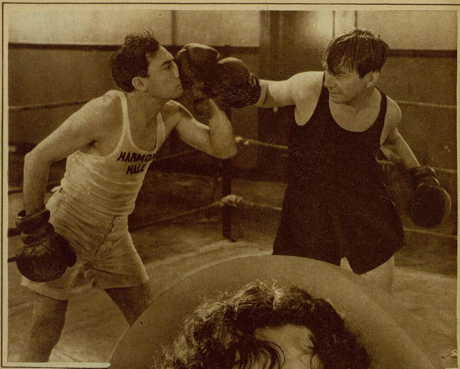
BUSTER KEATON Y SID TAYLOR, EN UNA GRACIOSA PELEA