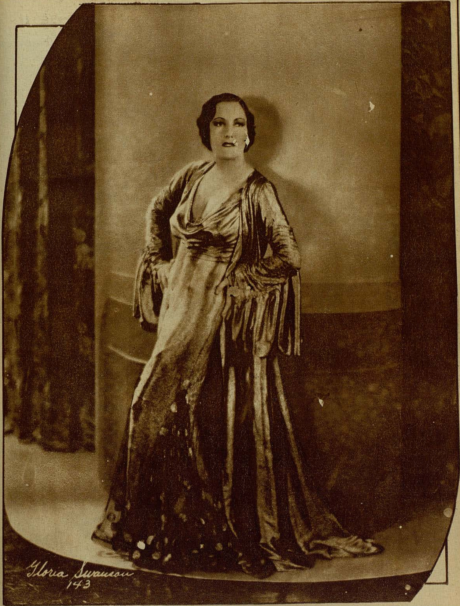
La célèbre artista Gloria Swanson