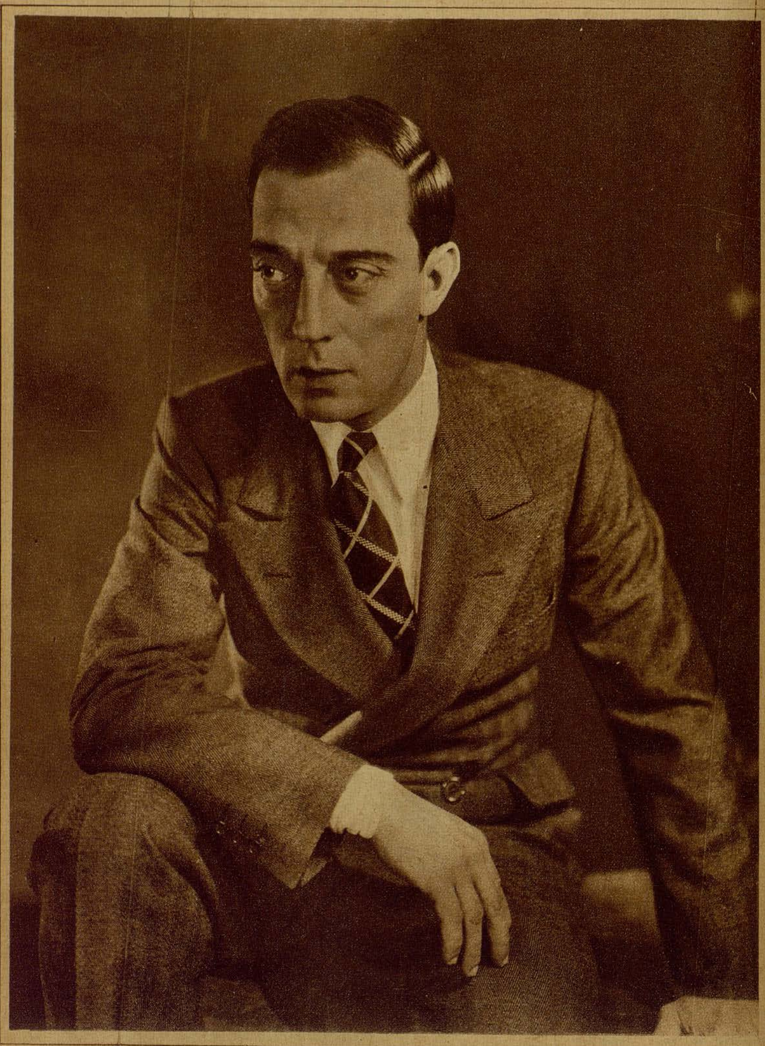
Una reciente fotografía del gran mimo Buster Keaton (el hombre que nunca ríe)