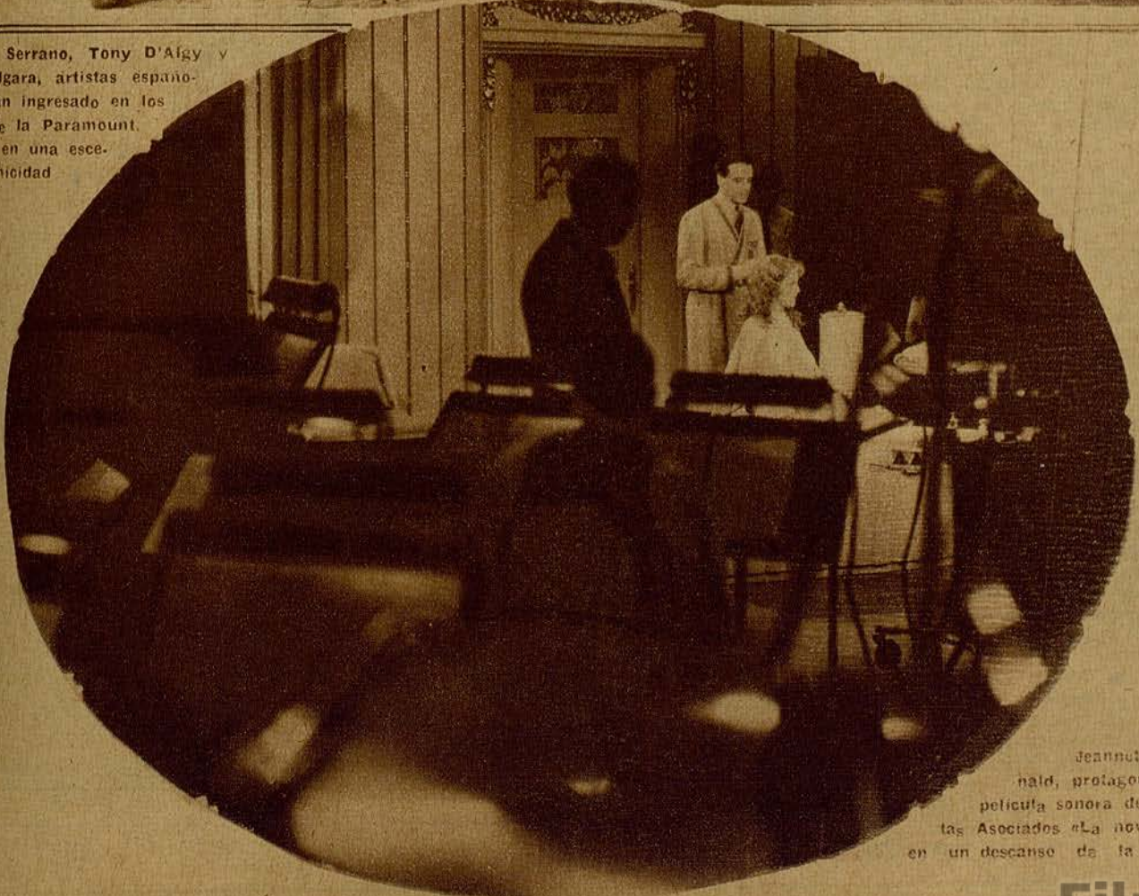
Jeannette Mac Donald, protagonista de la película sonora de los Artistas Asociados «La novia del 66», en un descanso de la filmación