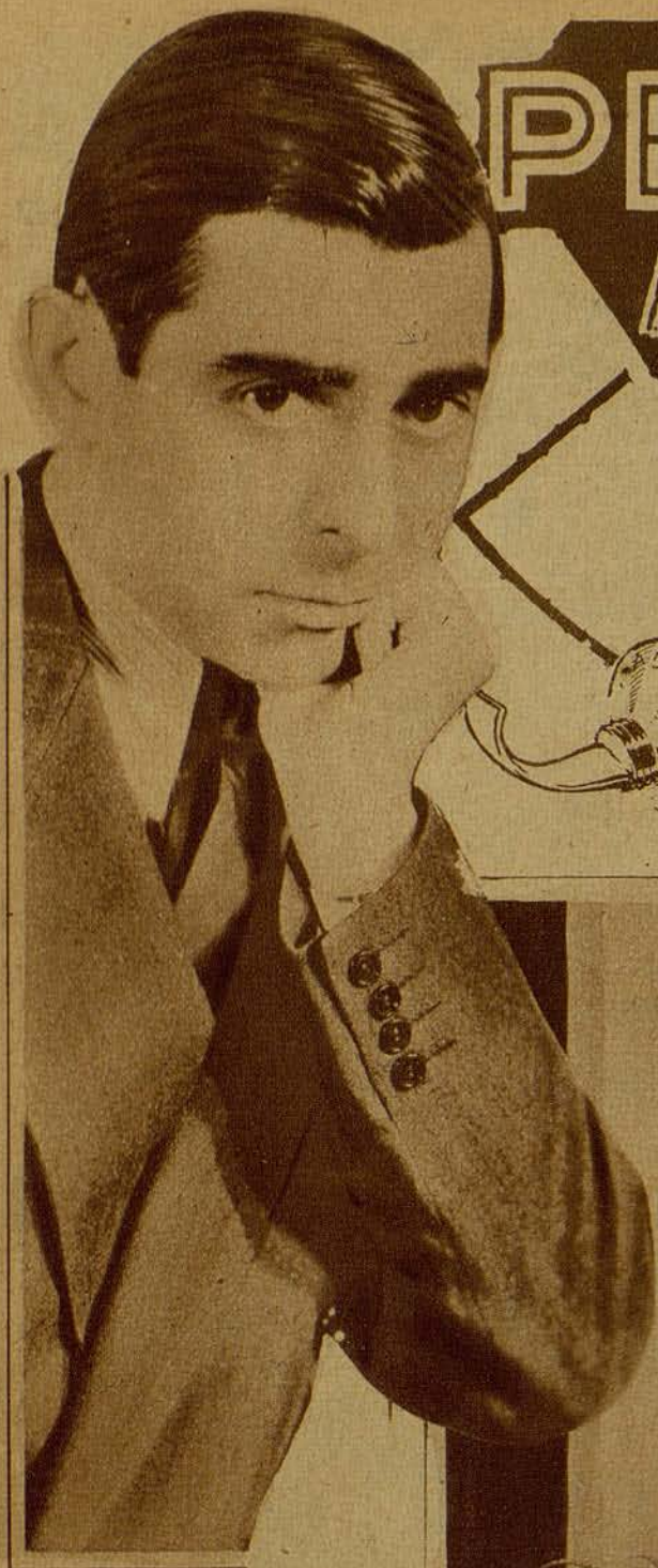
Eddie Cantor, nuevo artista del cine sonoro