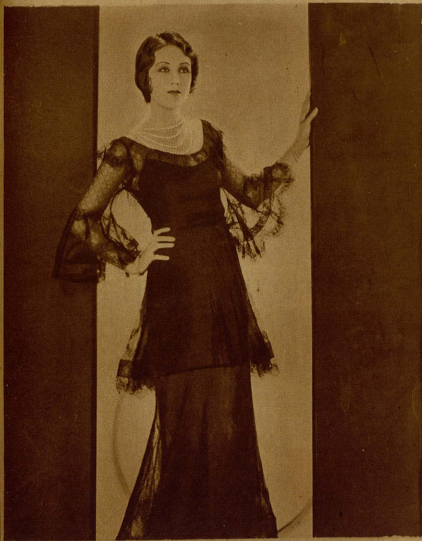
Fay Bray, gentil artista de la Paramount