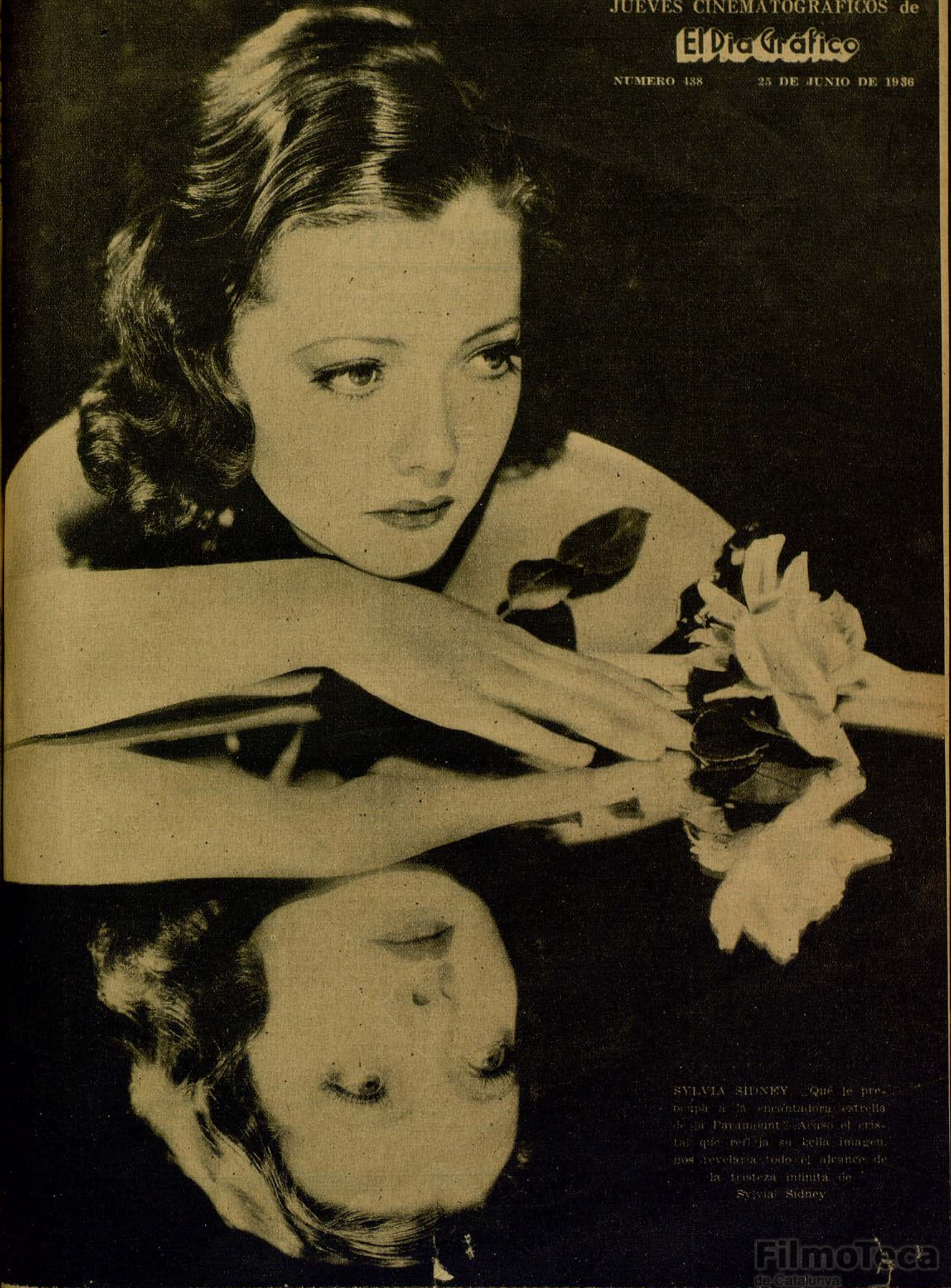
SYLVIA SIDNEY... ¿Qué le pre- ocupa a la encantadora estrella de la Paramount? A eso el cris- tal que refleja su bella imagen nos revelaría todo el alcance de la tristeza infinita de Sylvia Sidney