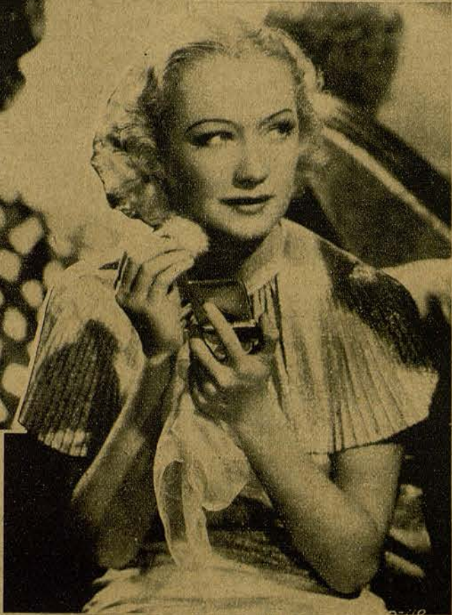
MIRIAM HOPKINS. ¿Qué? ¿Que ya estoy guapa así? ¿Y qué, si yo aspiro a estar más guapa todavía? - (Fot. Artistas Asociados)