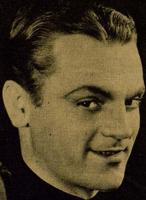
JAMES CAGNEY, porque tiene cara de pícaro y ca- riñoso a un tiempo.