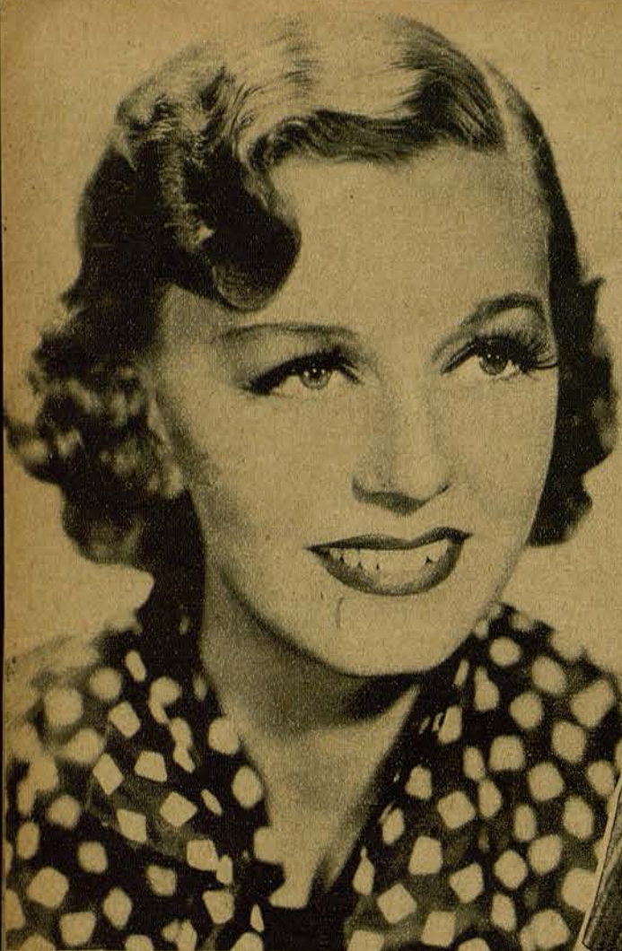
MARGARET SULLIVAN. Con un aire de gitana española que enamora.