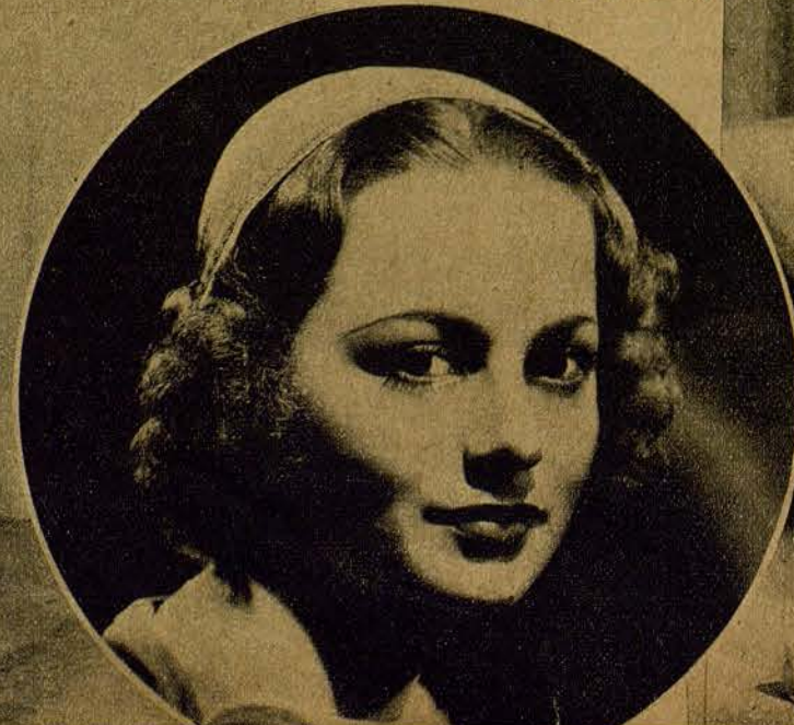
OLIVIA DE HAVILLAND. Tradición, pasado, algo de la Gioconda. ¡Si la hubiera conocido Benvenuto Cellini!