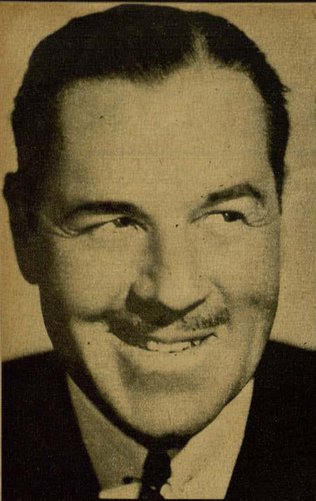
JACK HOLT, porque tiene aire de hombre socarrón.