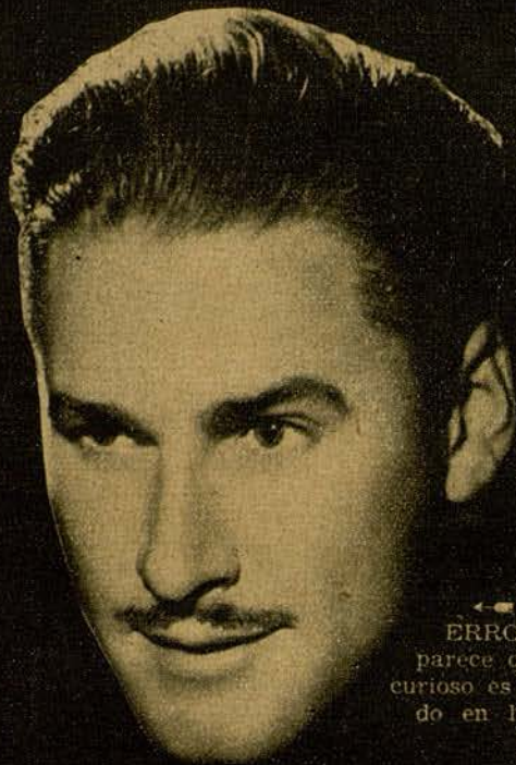
ERROL FLYN, porque... pa- parece que se fija en todo. Y lo curioso es que si se fija, sobre to- do en las mujeres guapas.