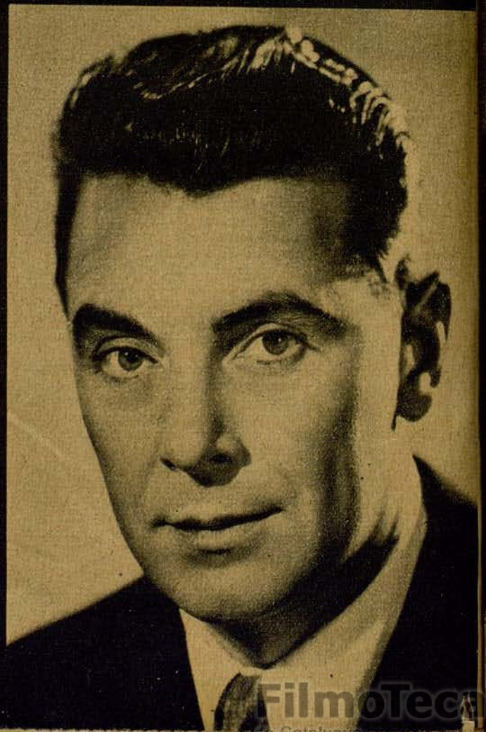
GEORGE BRENT, porque es to- do lo contrario: seríote, formal...