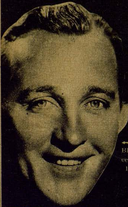
BING CROSBY, porque pare- ce un adolescente... Un ado- lescente enterado como un viejo.