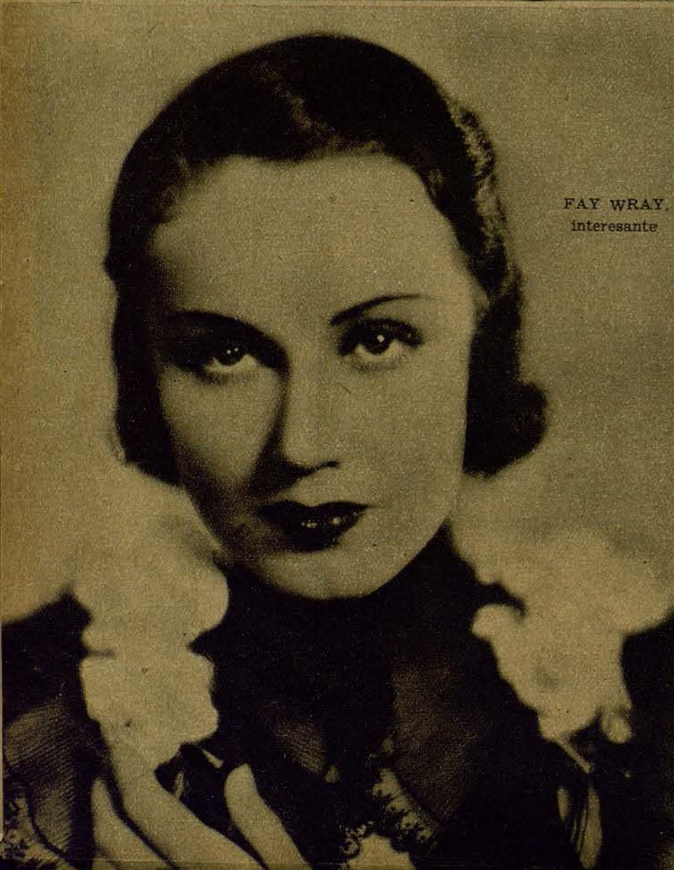
FAY WRAY, interesante