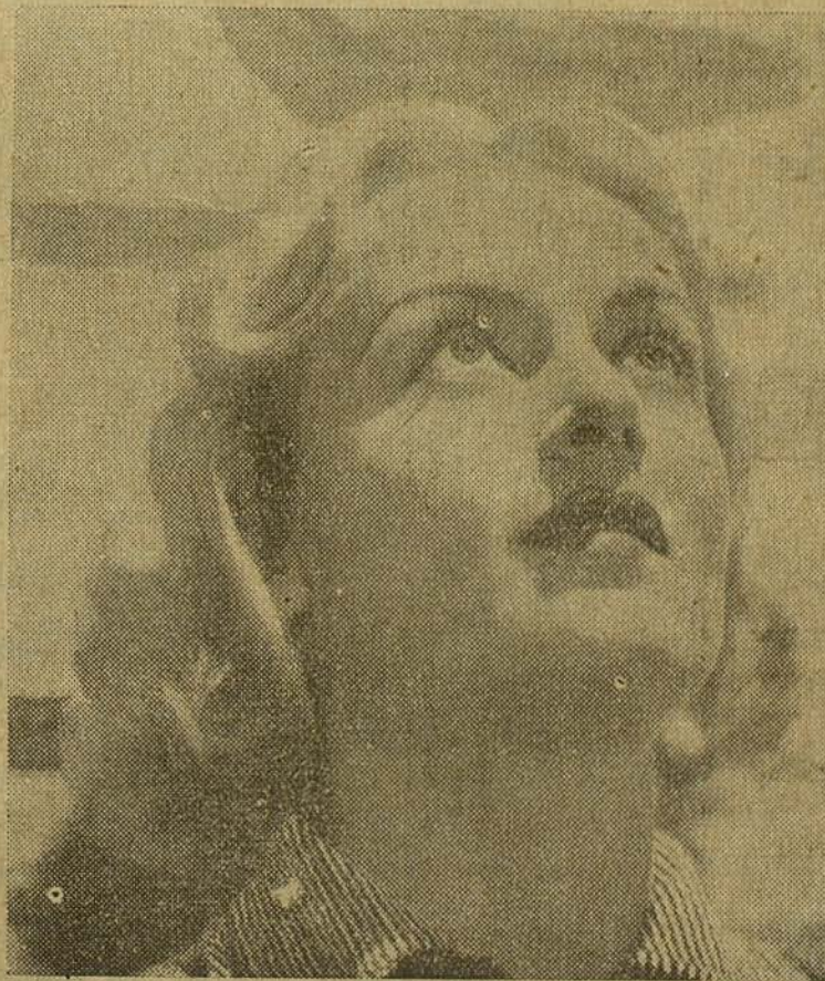
Carole Lombard, la personificación de la elegancia en la pantalla

No obstante, Hollywood no admira a Nelson Eddy por sus proezas en esos deportes, sino porque es "un chico simpático" y un artista notable, que no tuvo a menos trabajar duro y esperar largo tiempo hasta que le llegó la hora de triunfar.