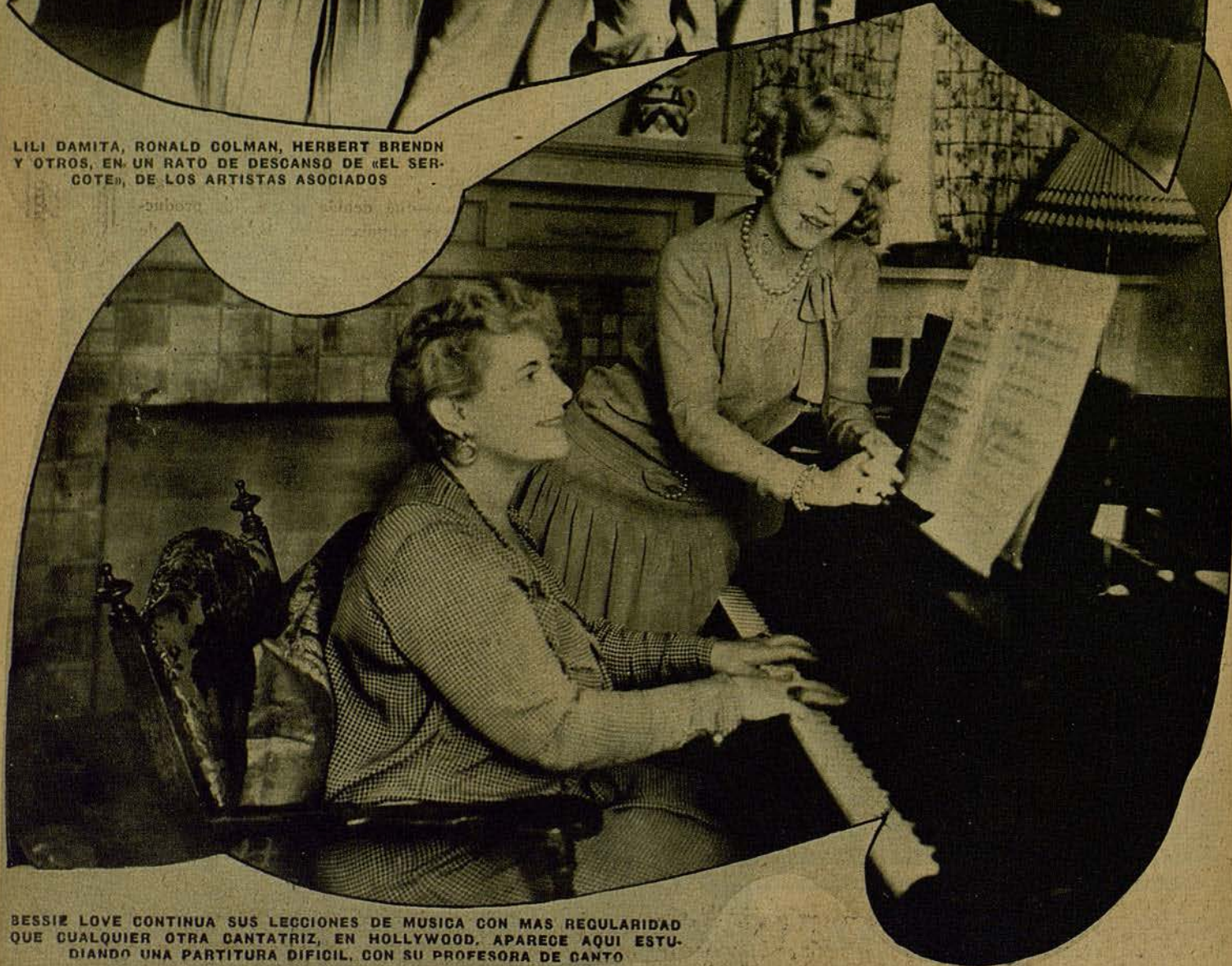
BESSIE LOVE CONTINUA SUS LECCIONES DE MUSICA CON MAS REGULARIDAD QUE CUALQUIER OTRA CANTATRIZ, EN HOLLYWOOD. APARECE AQUI ESTU- DIANDO UNA PARTITURA DIFICIL, CON SU PROFESORA DE CANTO