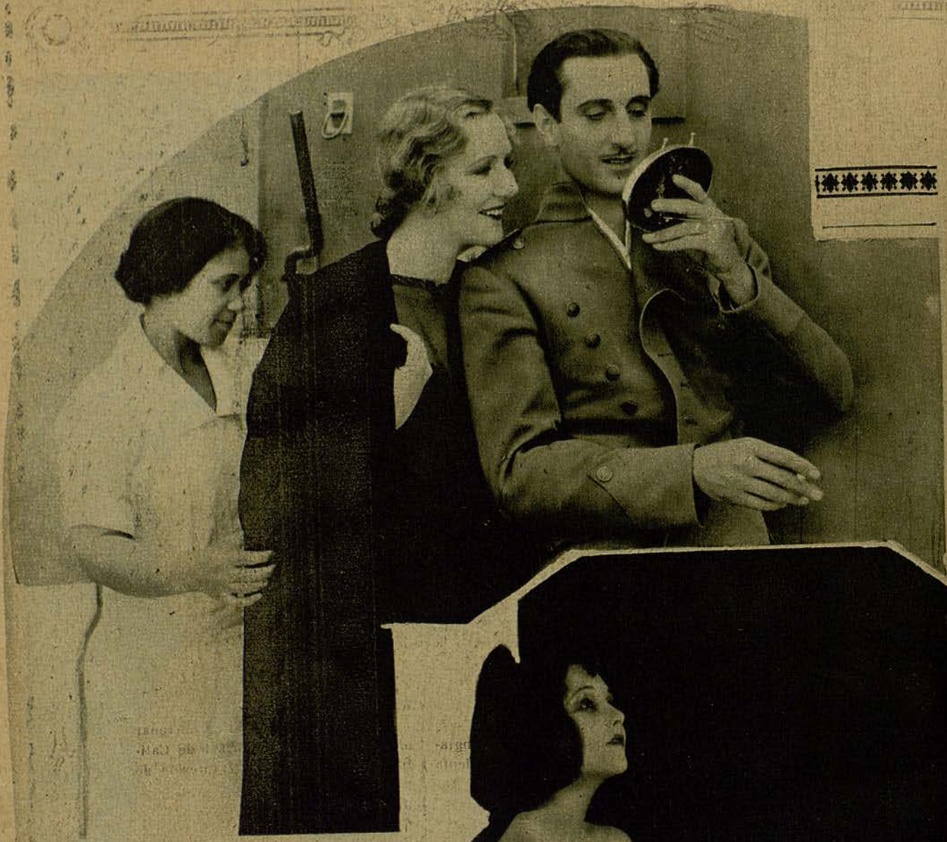
«NO ES ASUNTO DE RISA», PROTESTA BASIL RATHBONE, MIENTRAS KAY JOHNSON SE MIRA AL ESPEJO, APA- RENTEMENTE MUY DIVERTIDA