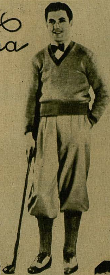
El de golf