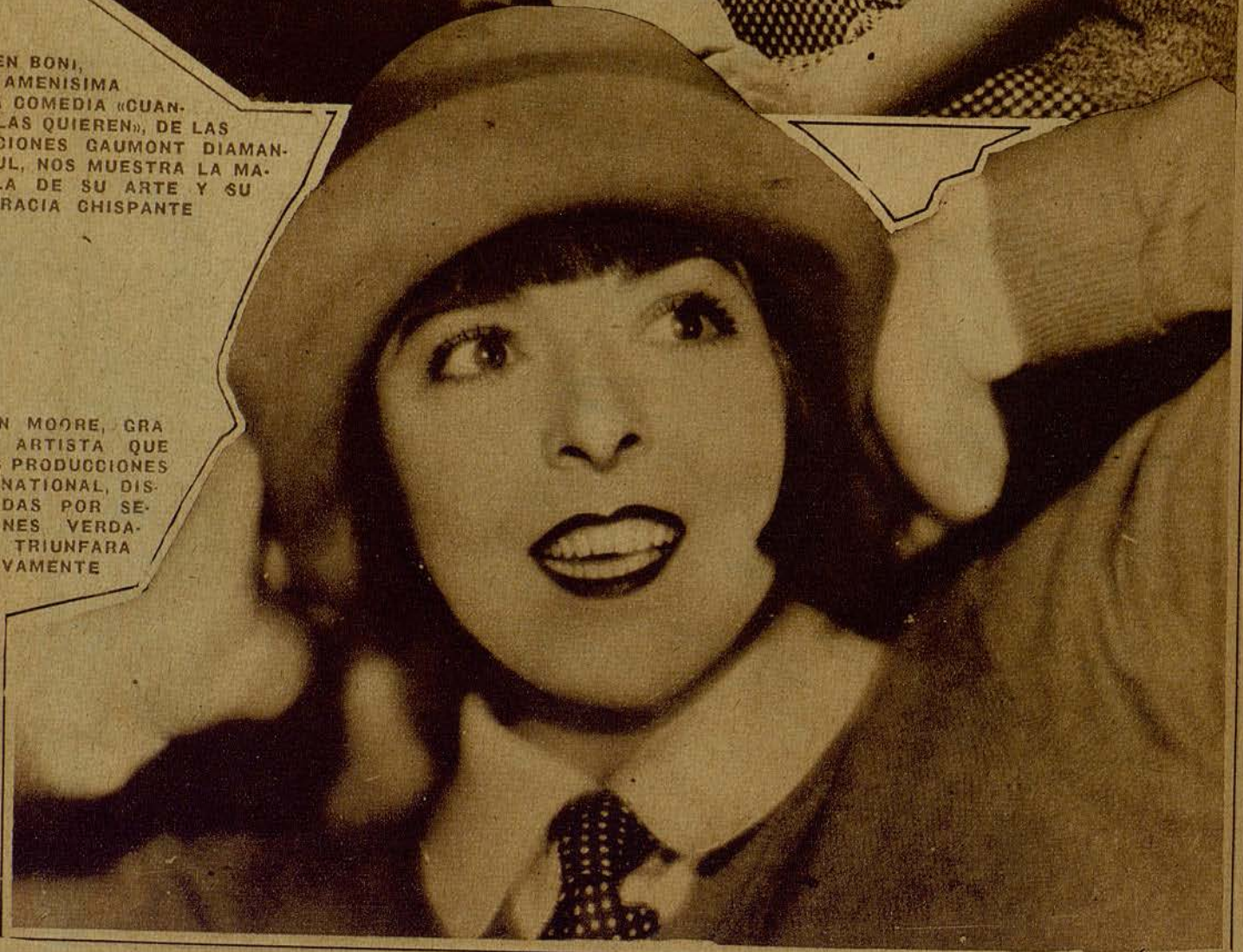
COLLEN MOORE, GRA- CIOSA ARTISTA QUE EN LAS PRODUCCIONES FIRTS NATIONAL, DIS- TRIBUIDAS POR SE- LECCIONES VERDA- QUER, TRIUNFARA NUEVAMENTE