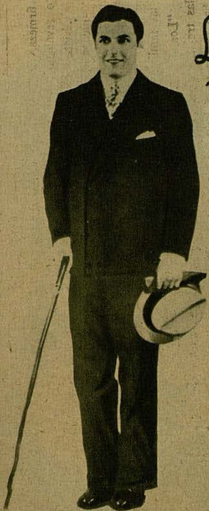
El traje de mañana