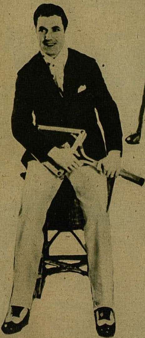
El de etiqueta