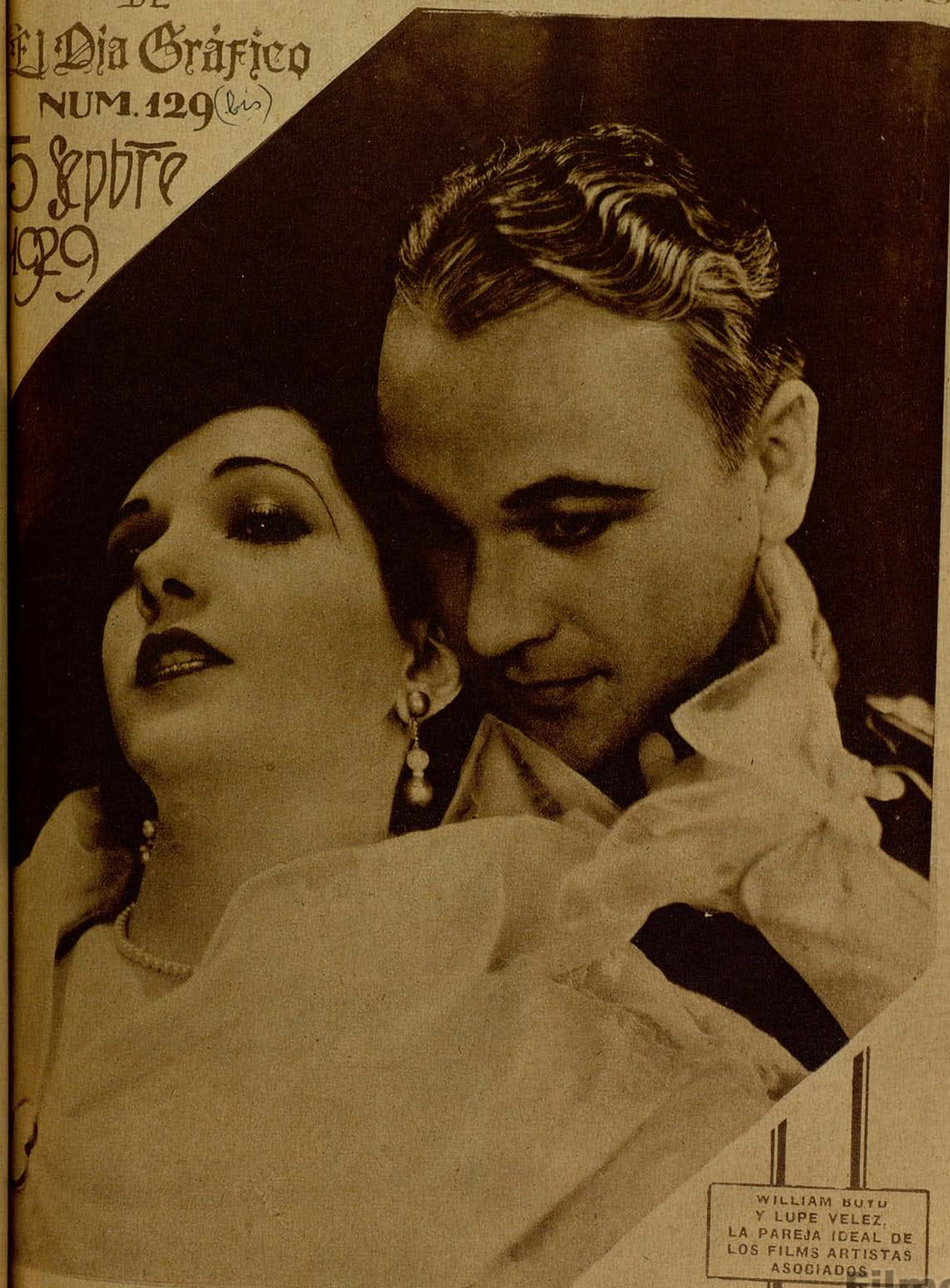
WILLIAM BUTU Y LUPE VELEZ, LA PAREJA IDEAL DE LOS FILMS ARTISTAS ASOCIADOS