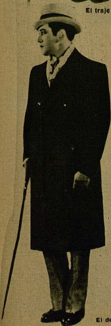
El de visita