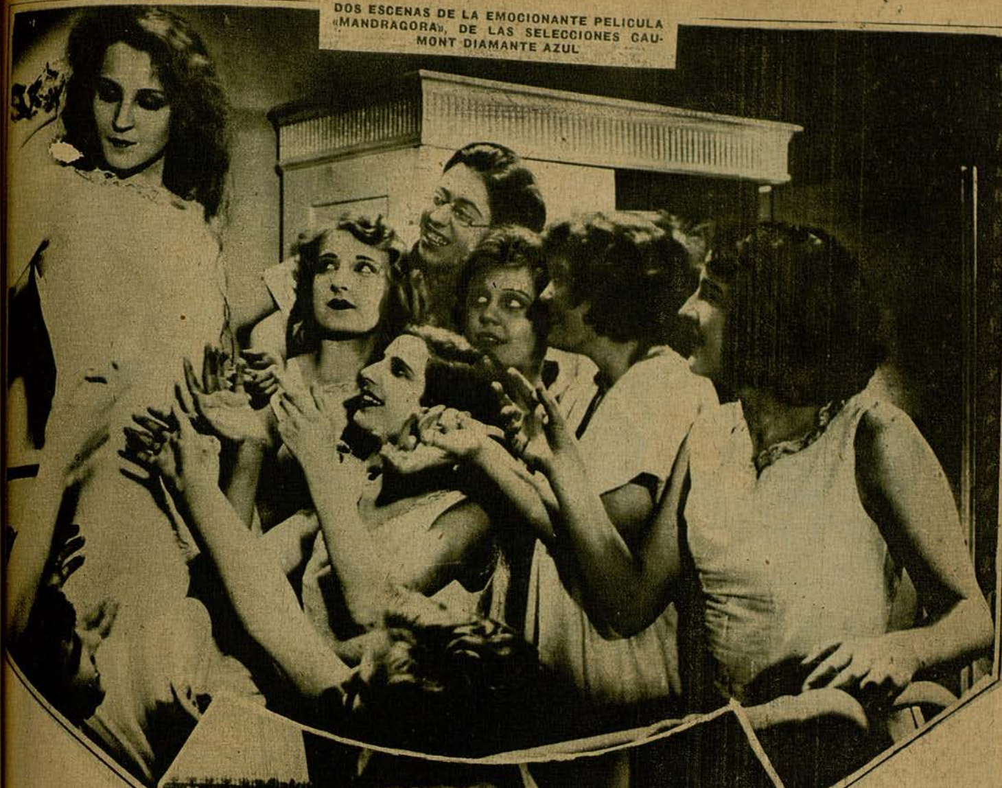
DOS ESCENAS DE LA EMOCIONANTE PELICULA "MANDRAGORA", DE LAS SELECCIONES GAU- MONT DIAMANTE AZUL