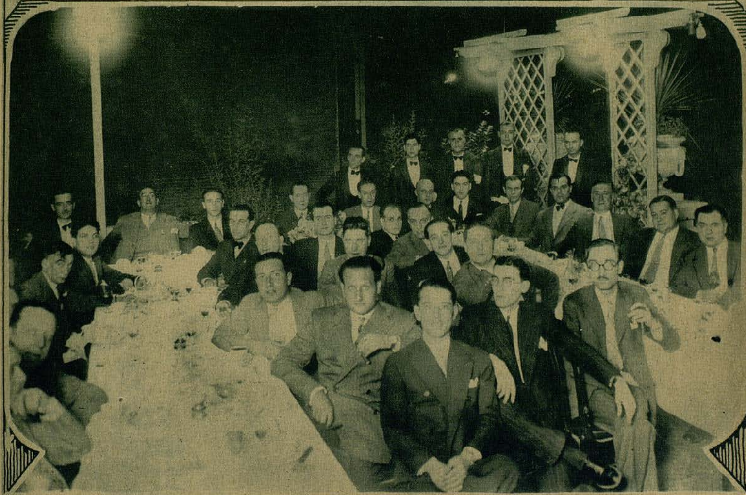
GRUPO DE CONCURRENTES AL BANQUETE DE LOS CINEASTAS, CELEBRADO EN EL RESTAURANT JOANET, DE LA BARCELONETA.—(Fots. Badosa)