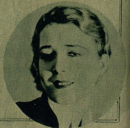
LOS FAMOSOS ARTISTAS DE CINE, AMERICANOS, CUYA VOZ SE OYE POR PRIMERA VEZ EN LAS PRODUCCIONES DE ESTE AÑO