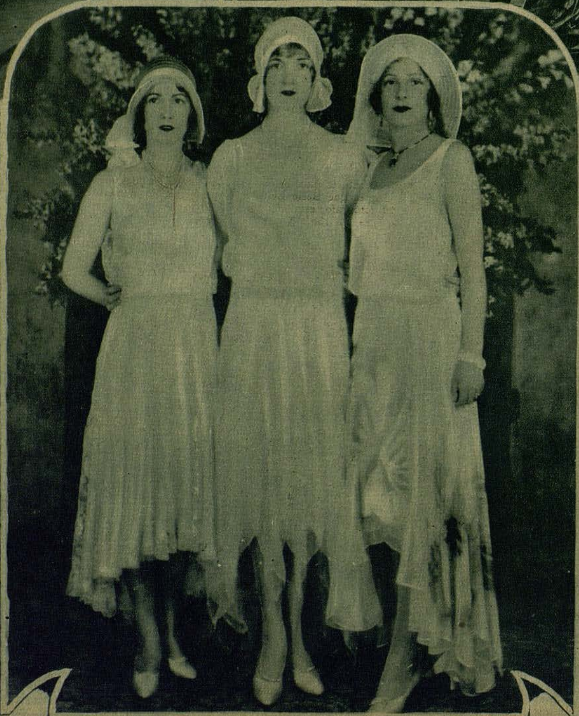
LAS INNOVACIONES IMPUESTAS EN HOLLYWOOD, POR EL NUEVO SISTEMA DE PELICULAS HABLADAS