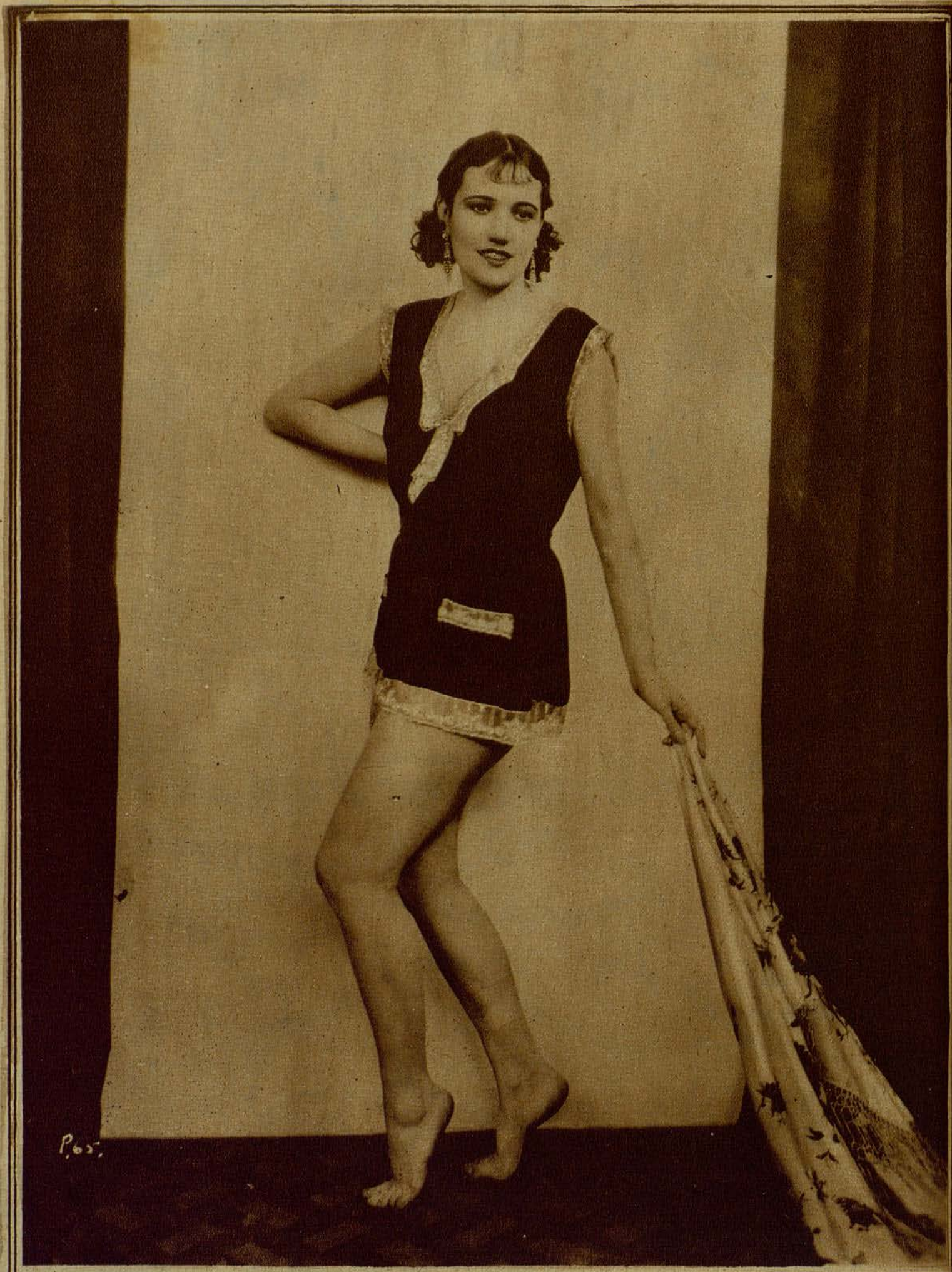
JULIA SUEDO, LA BELLA INTERPRETE DE «LA LUCHA POR EL TROFEO»