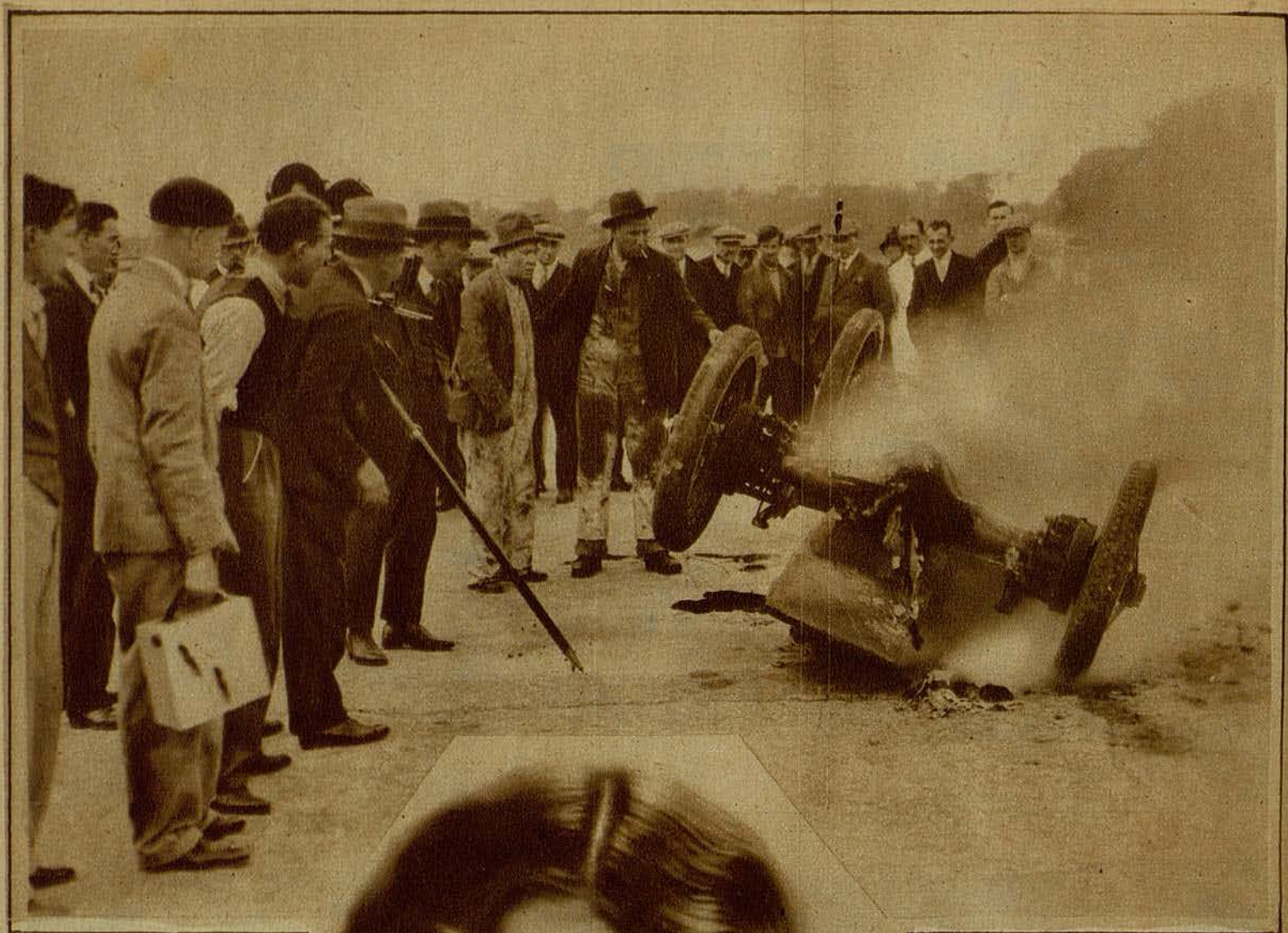
FILMANDO UN MOMENTO INTERESANTE DE LA PELICULA «LA LUCHA POR EL TROFEO»