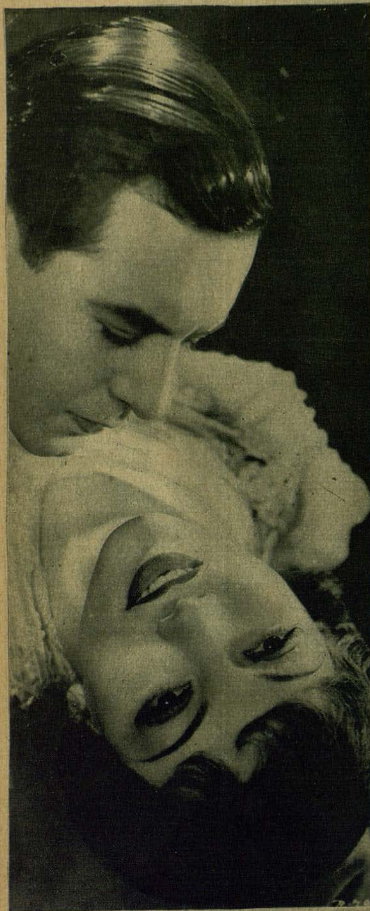
Claudette Colbert y Ben Lyon, en una escena de «A la sombra de los muelles», film de los Artistas Asociados