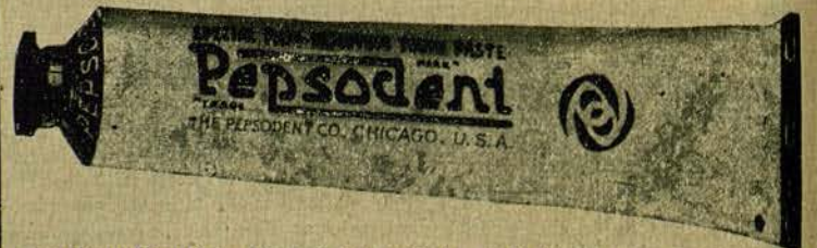
La Pasta Dentífrica Especial que elimina la Película 5015

Use Pepsodent dos veces al día — Vea a su dentista dos veces al año