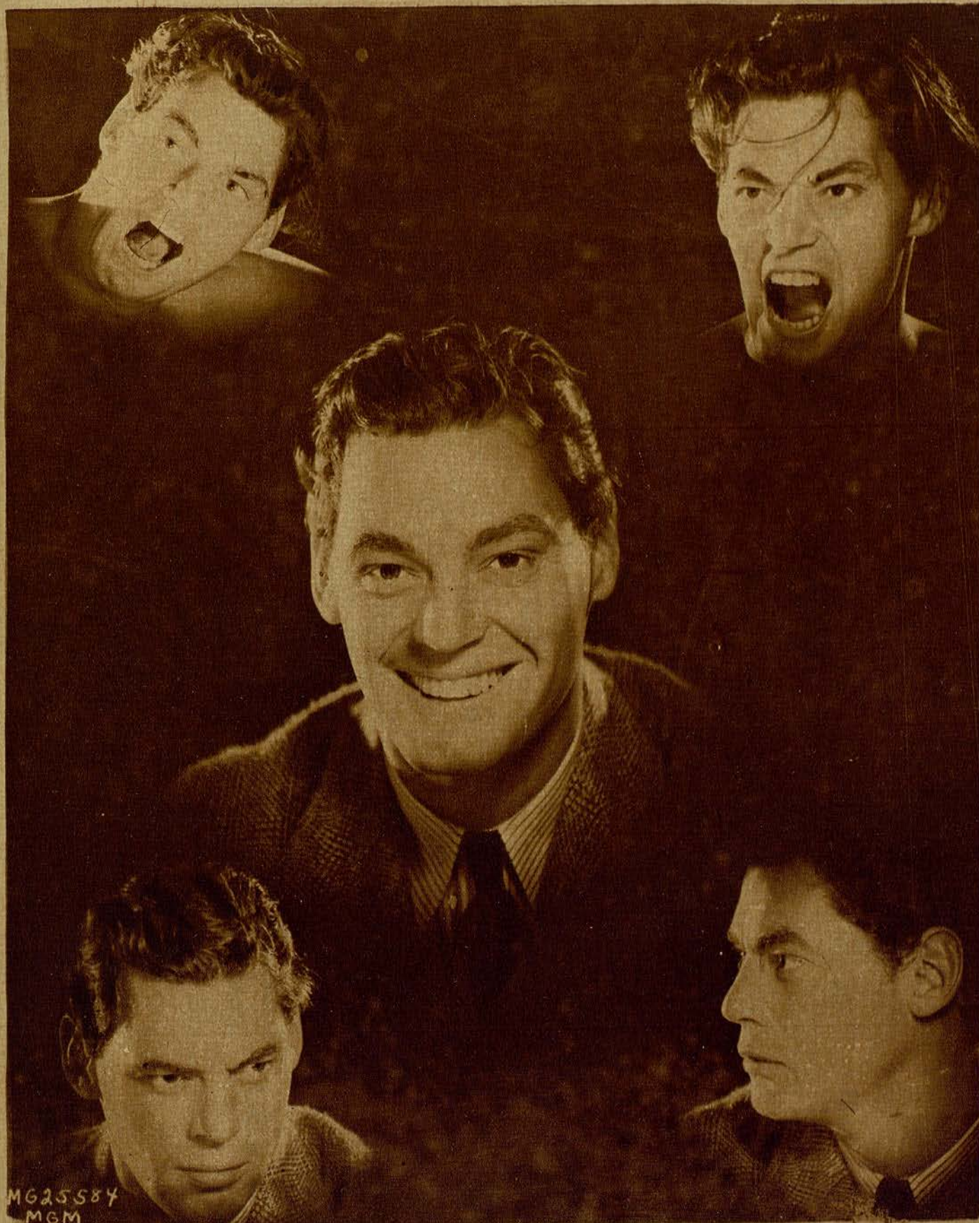
El joven actor Johnny Weismuller, de la M. G. M., en algunas de sus caracterizaciones