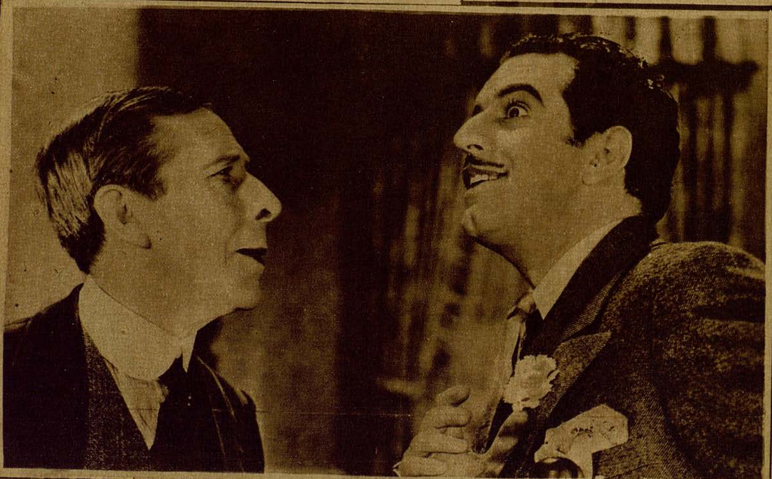
Fortunio Bonanova, notabilísimo actor, en una interesante escena de la película «Successful Calamity», cuyo título español no ha sido dado todavía