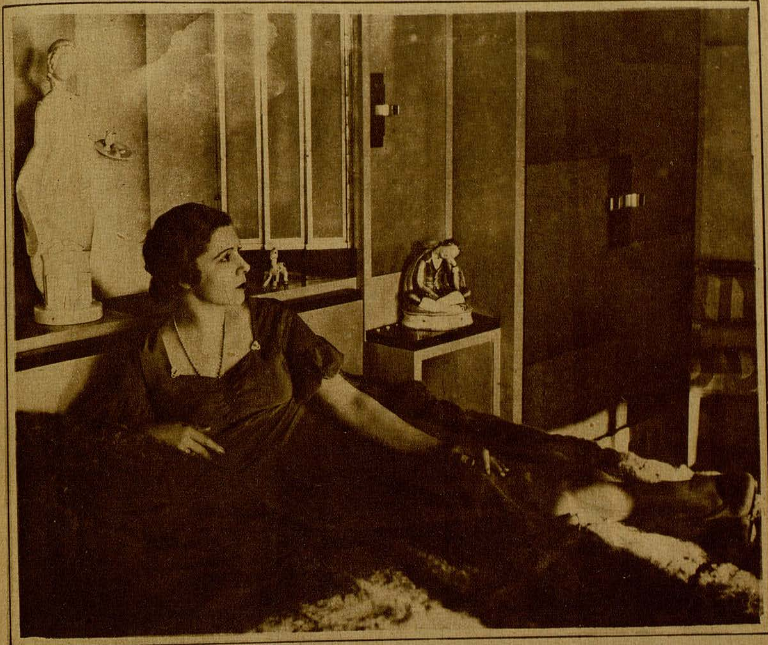
Catalina Bárcena, la actriz exquisita, estrella de primera magnitud en el firmamento cinematográfico, que retorna a Hollywood para «rodar» películas en español.

Esta exquisita actriz, gloria de la escena española, partirá dentro de algunos días para Hollywood, para continuar, bajo la marca de Fox Film, la producción de películas habladas en español.