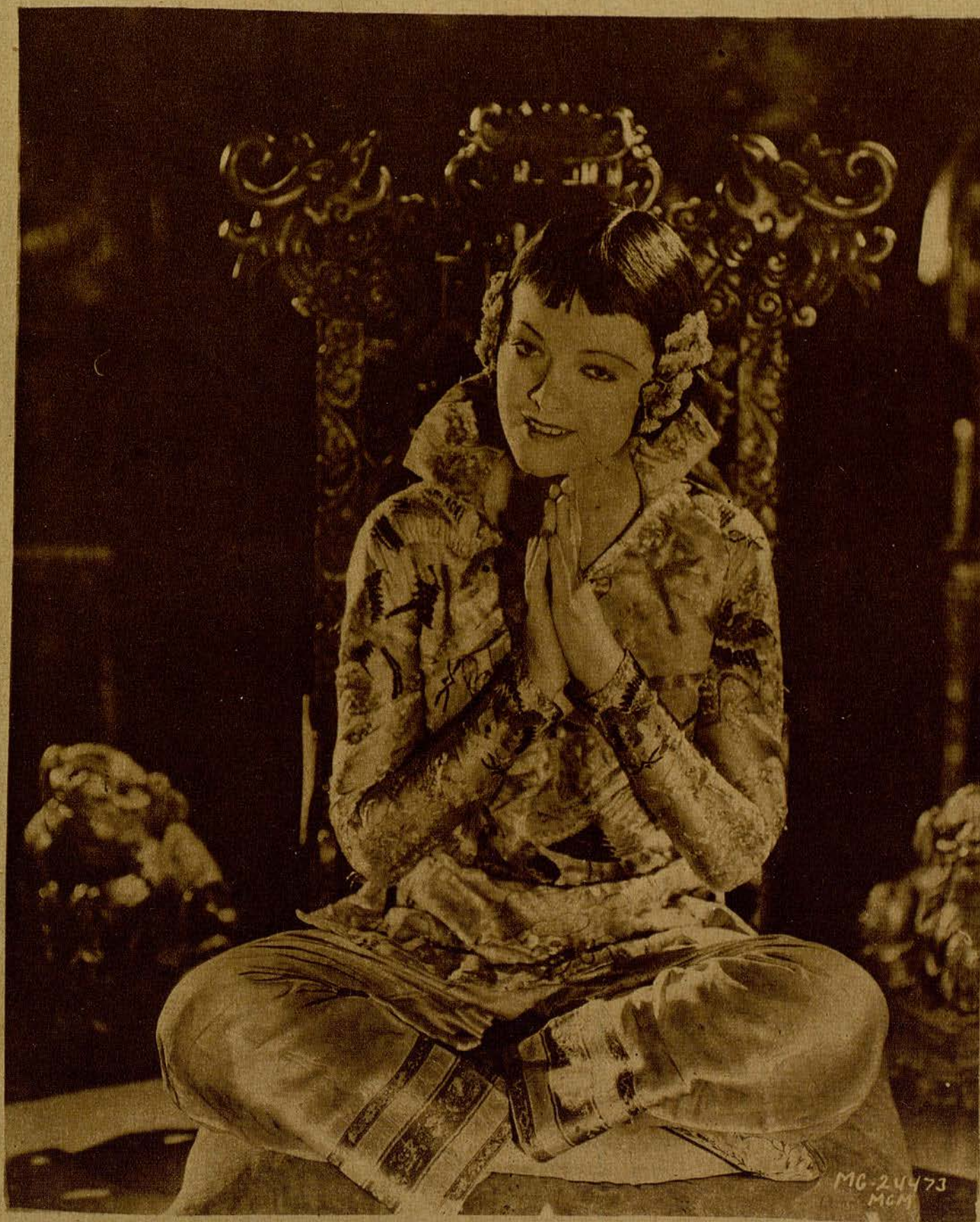
Una de las actrices que han alcanzado mayor reputación en la interpretación de personajes orientales, ha sido, sin duda, Mirna Lov, que hoy pertenece al elenco de la M. G. M.