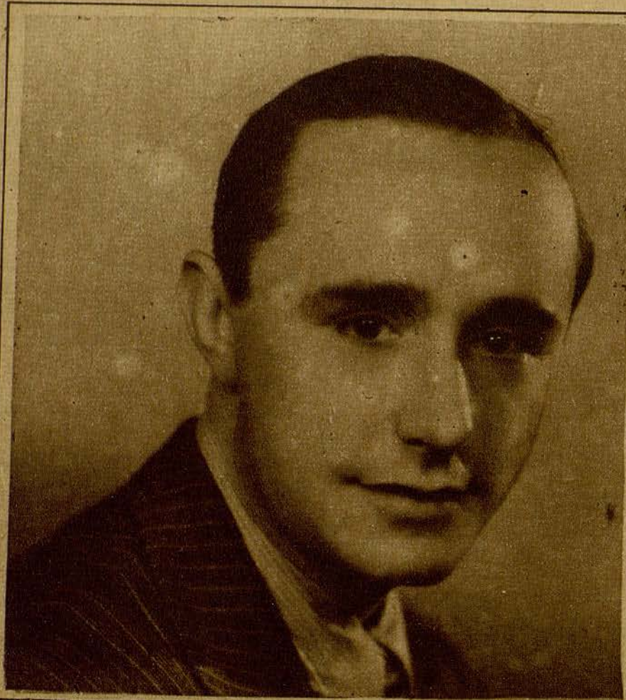
Benito Perojo, el gran director español, que bien puede titularse la esperanza española, luego de su admirable dirección en «Mamá». Tenemos noticias de otras actuaciones suyas, como director, que veremos en la temporada próxima a inaugurarse