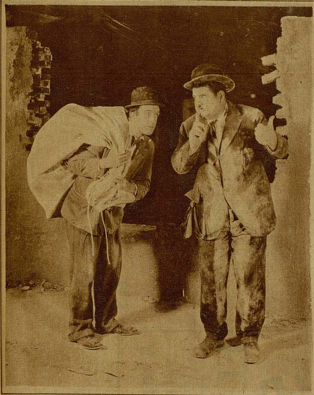
Oliver Hardy y Stan Laurel, la pareja de cómicos más célebre de las comedias de Hal Roach, quien ha decidido suprimir, desde ahora y en absoluto, el diálogo de las películas

do revisado y suprimido, finalmente, a la mínima expresión.