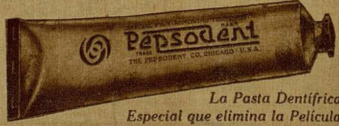
La Pasta Dentífrica Especial que elimina la Película 3001

Pida un tubo gratis de Pepsodent para 10 días a: Busquets Hermanos y Cia., Cortes, 591, - A. Barcelona