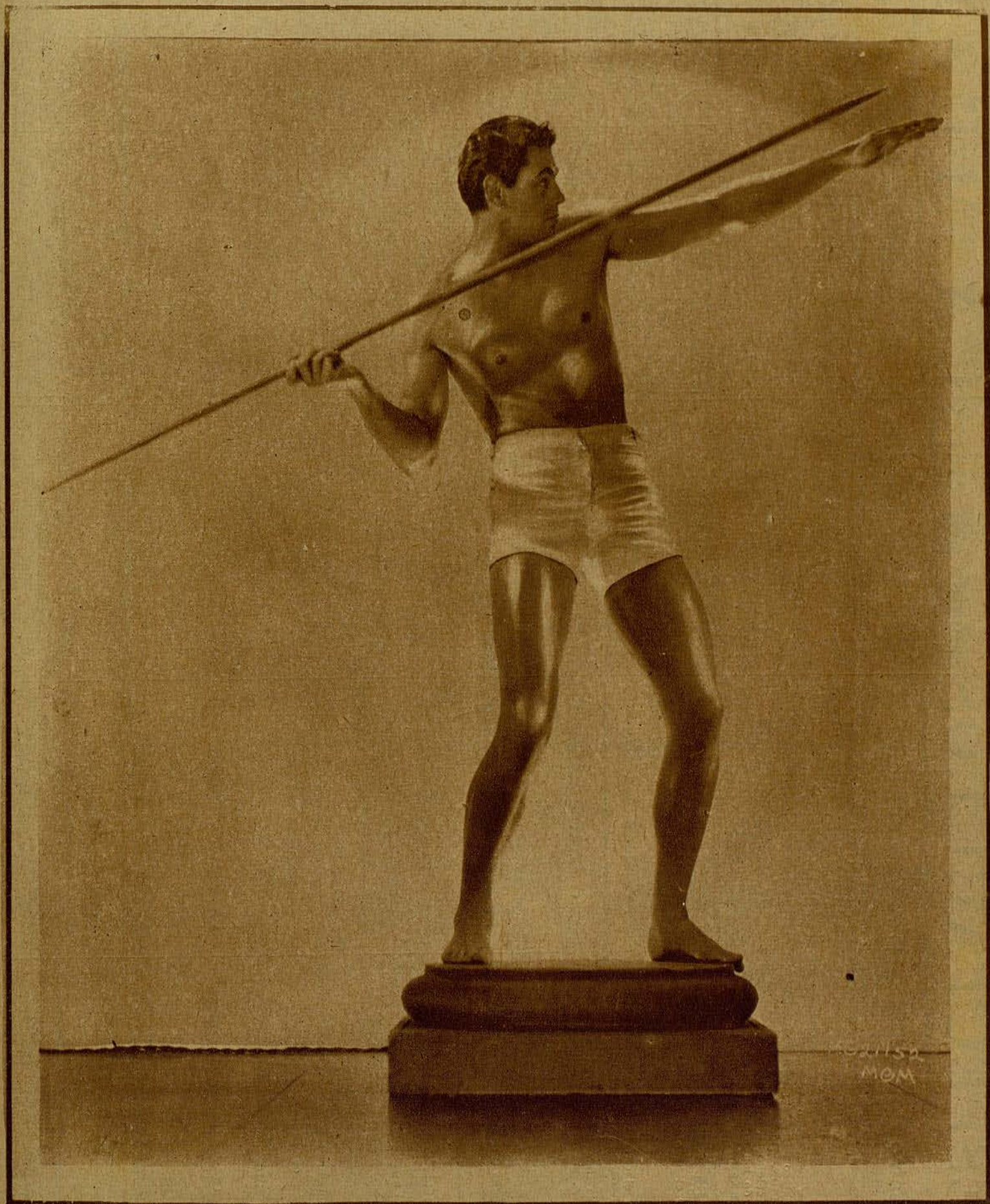
Johnny Weissmuller, campeón de natación, que ha ingresado en la M. G. M.