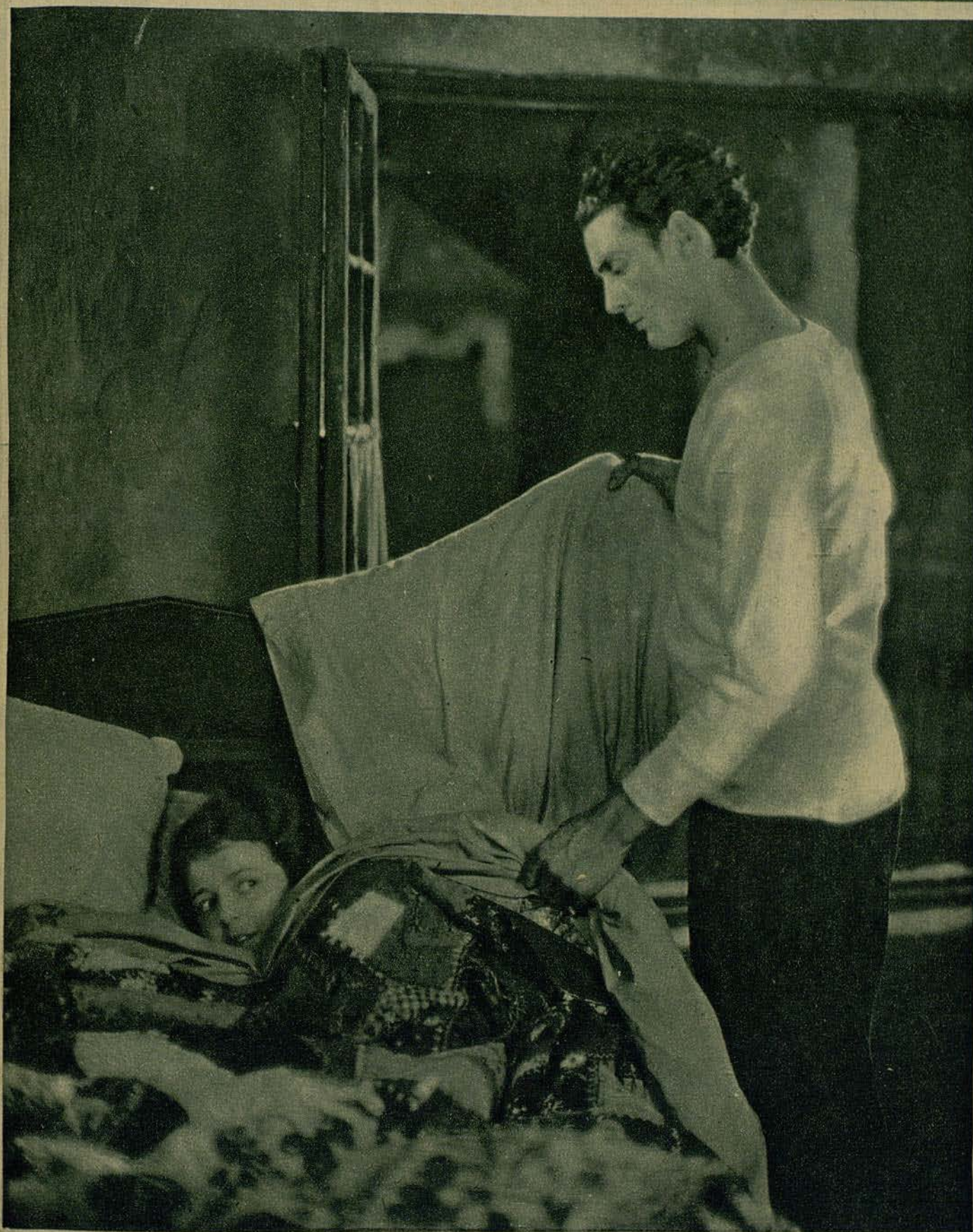
JANET GAYNOR Y CHARLES FARRELL EN UNA ESCENA DEL FILM FOX «EL SEPTIMO CIELO»