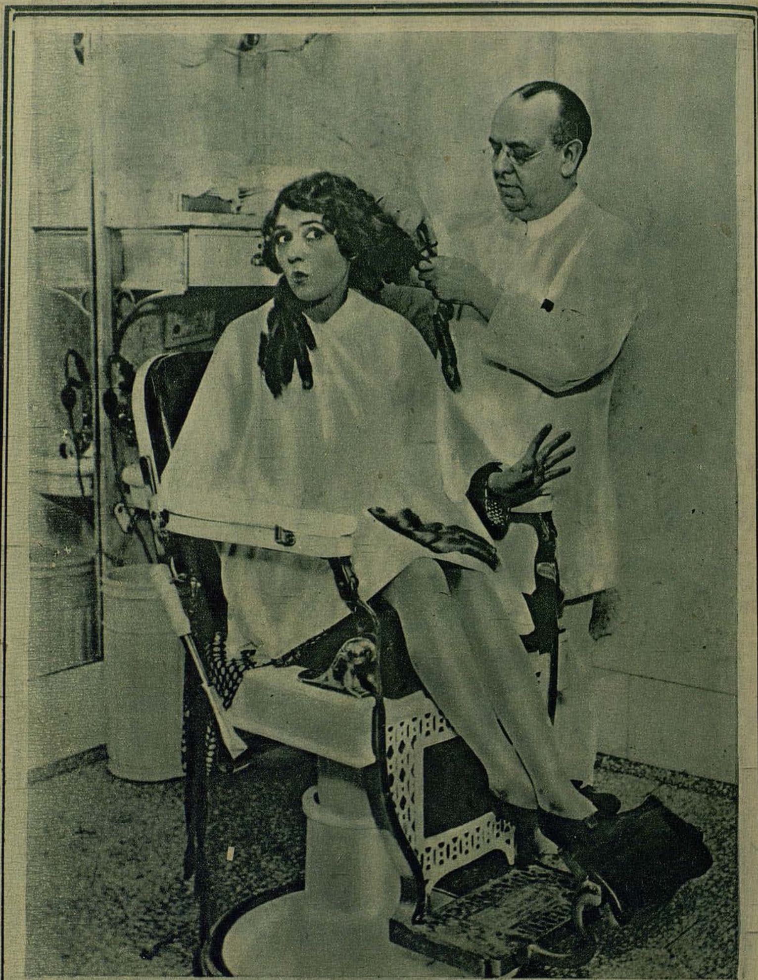
MARY PICKFORD, VENCIDA POR LA MODA, SE HA HECHO CORTAR SUS BELLOS BUCLES. EL OBJETIVO LA HA SOR- PRENDIDO EN TAN DURO TRANCE