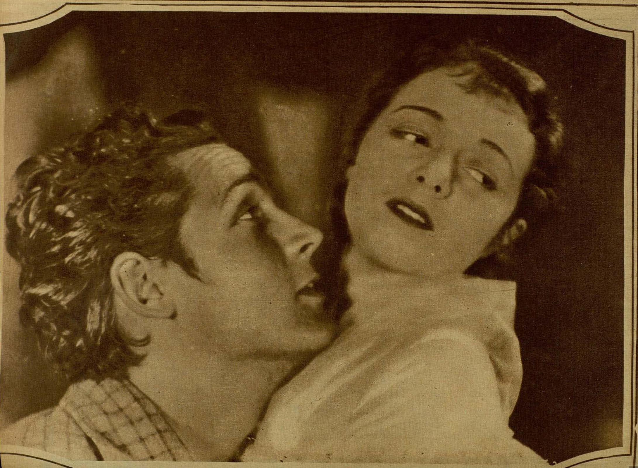
CHARLES FARRELL Y JANET GAYNOR EN «EL SEPTIMO CIELO». SEGUNDO PREMIO «DEL PLEBISCITO». LA GLORIOSA CARRERA DE ESTA PAREJA IDEAL QUE ELEVO NUESTRO ESPIRITU A CELESTIALES ALTURAS. CULMINA EN SU ULTIMO FILM TITAN FOX «EL ANGEL DE LA CALLE».