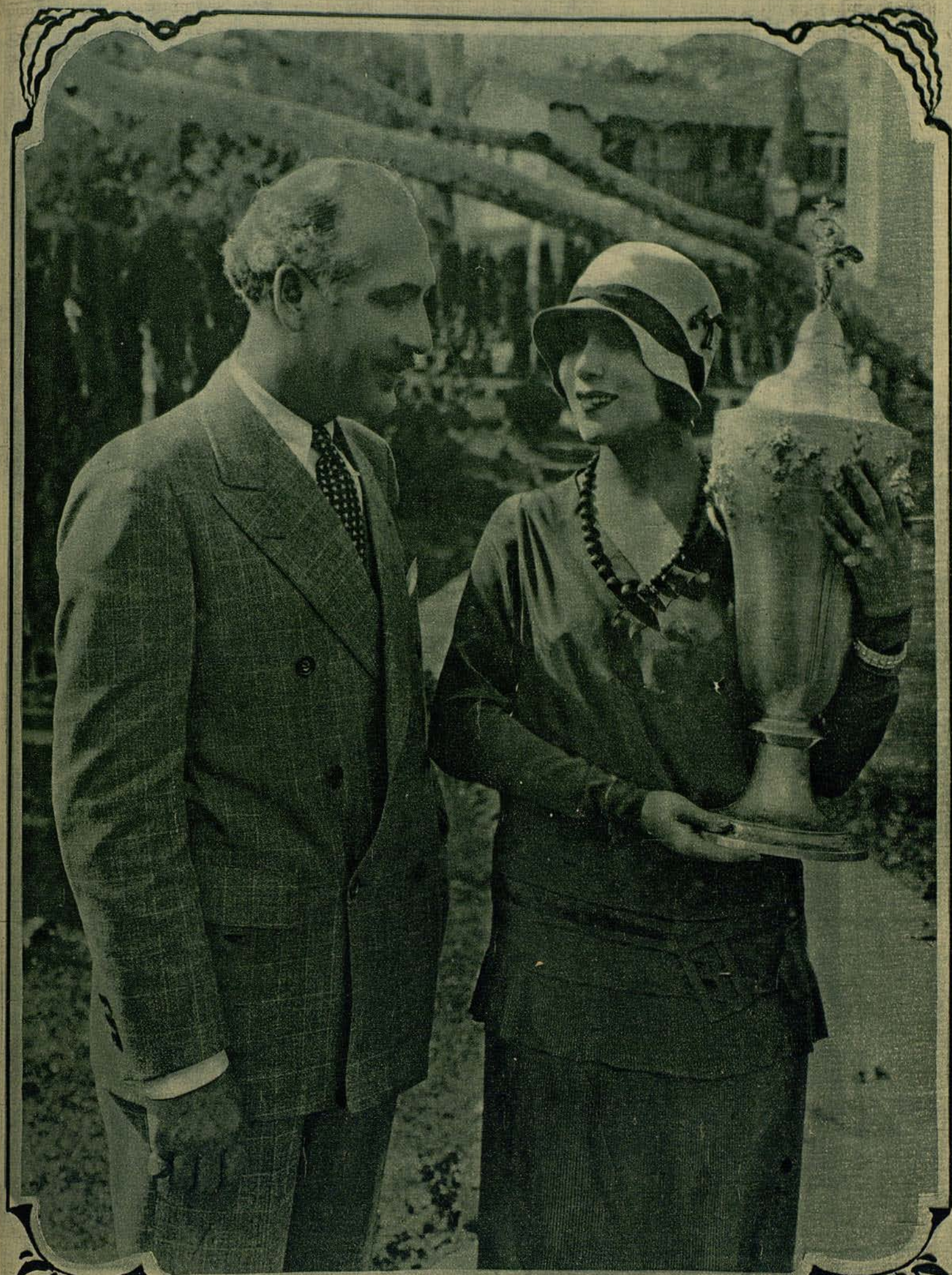
EDWIN CAREWE, «DESCUBRIDOR» DE DOLORES DEL RÍO, Y LA JOVEN Y BELLA ARTISTA, ESTRELLA CINEMATOGRAFICA DE LOS ARTISTAS ASOCIADOS, A QUIEN LE HA SIDO CONCEDIDO EL TROFEO «WAMPAS», DURANTE LA FIESTA ANUAL CELEBRADA ANTE UN PÚBLICO QUE EXCEDÍA DE DIEZ MIL PERSONAS