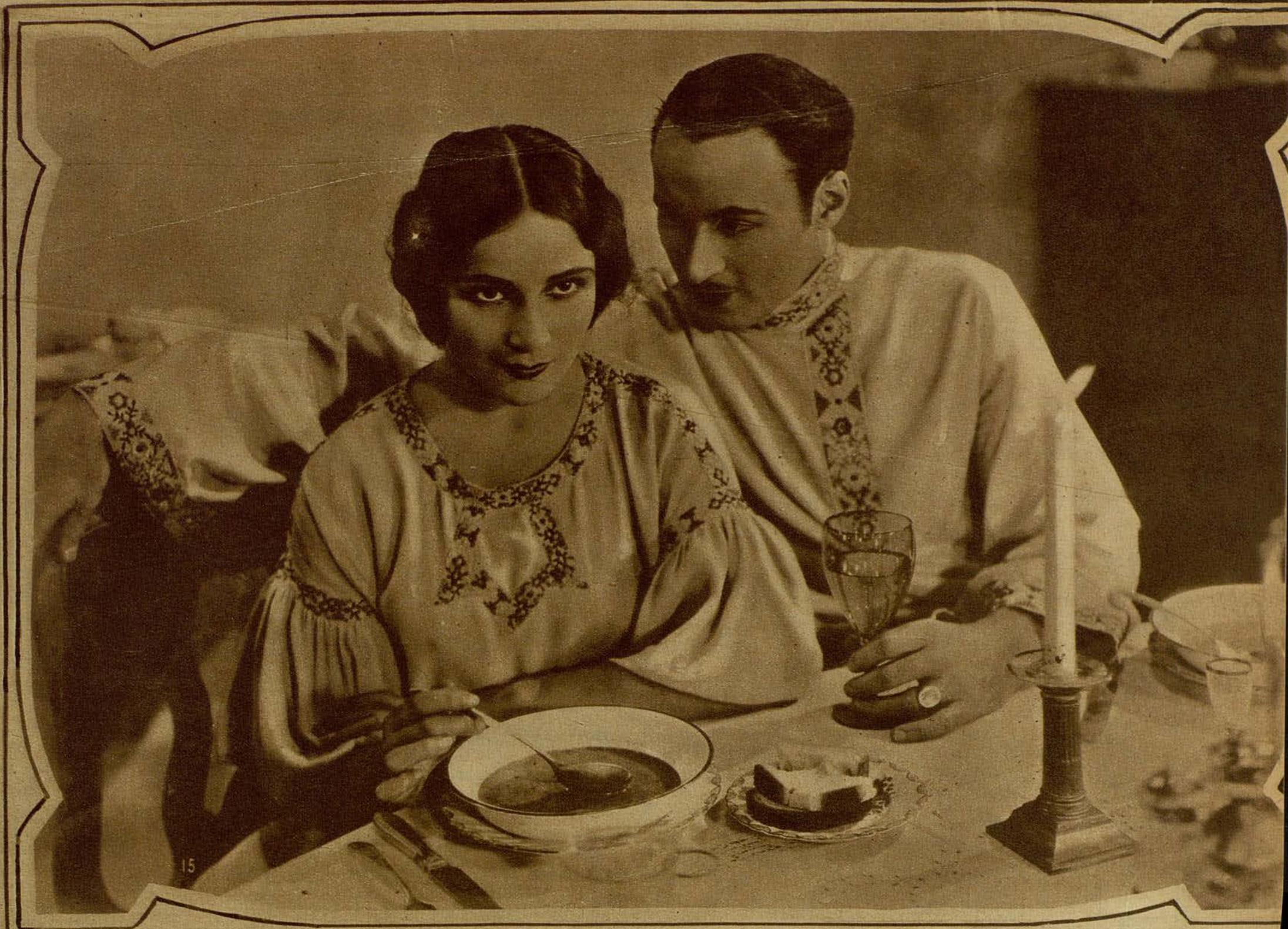
DOLORIS DEL RIO, QUE HA OBTENIDO EL PRIMER PREMIO «COPA DE HONOR» POR SU BRILLANTE INTERPRETACION EN EL FILM DE «LOS ARTISTAS ASOCIADOS» RESURRECCION»