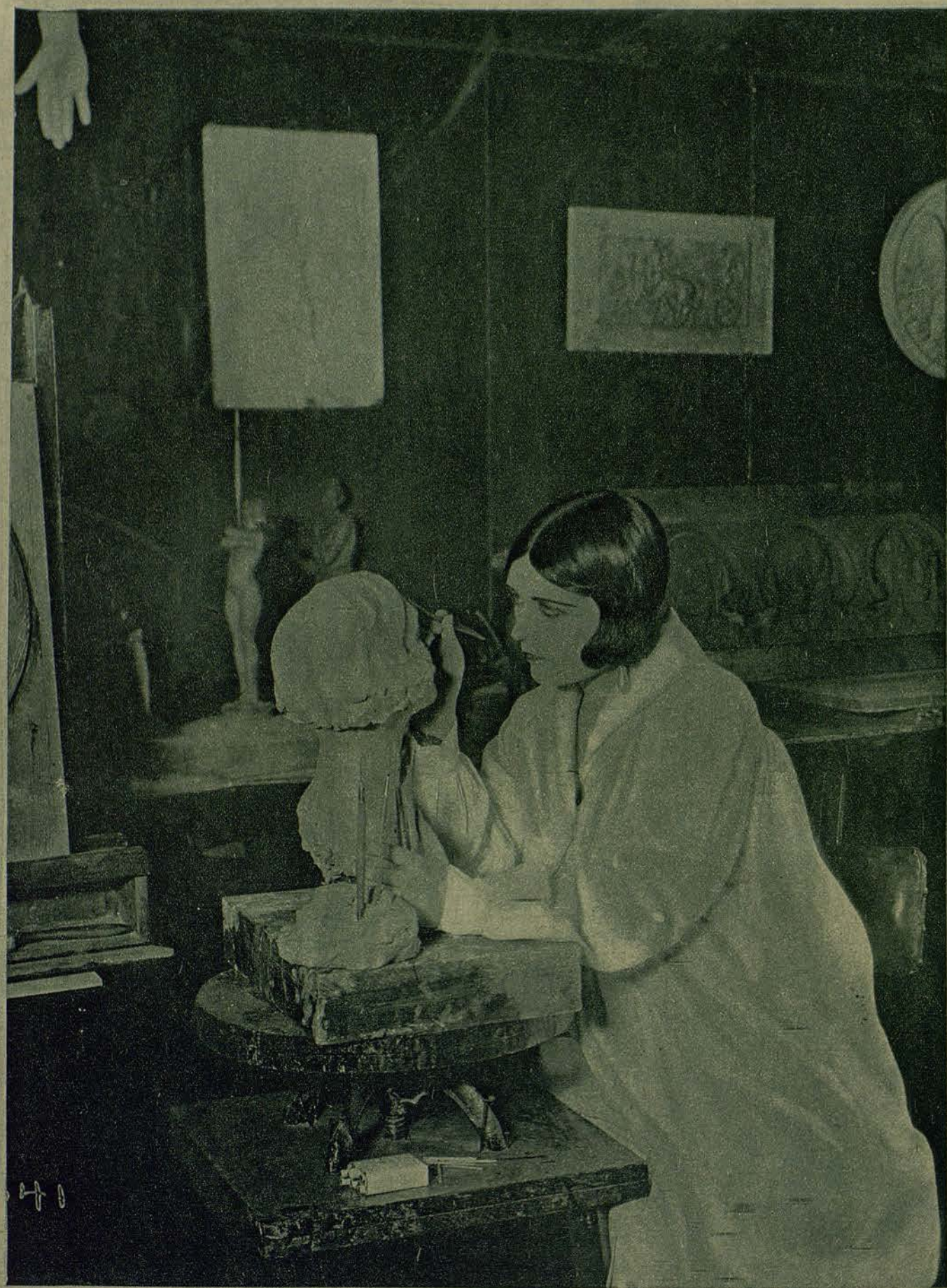
LA GENIAL ARTISTA POLA NEGRI, EN LAS VACACIONES, SE DEDICA A CULTIVAR EL NOBLE ARTE DE LA ESCULTURA