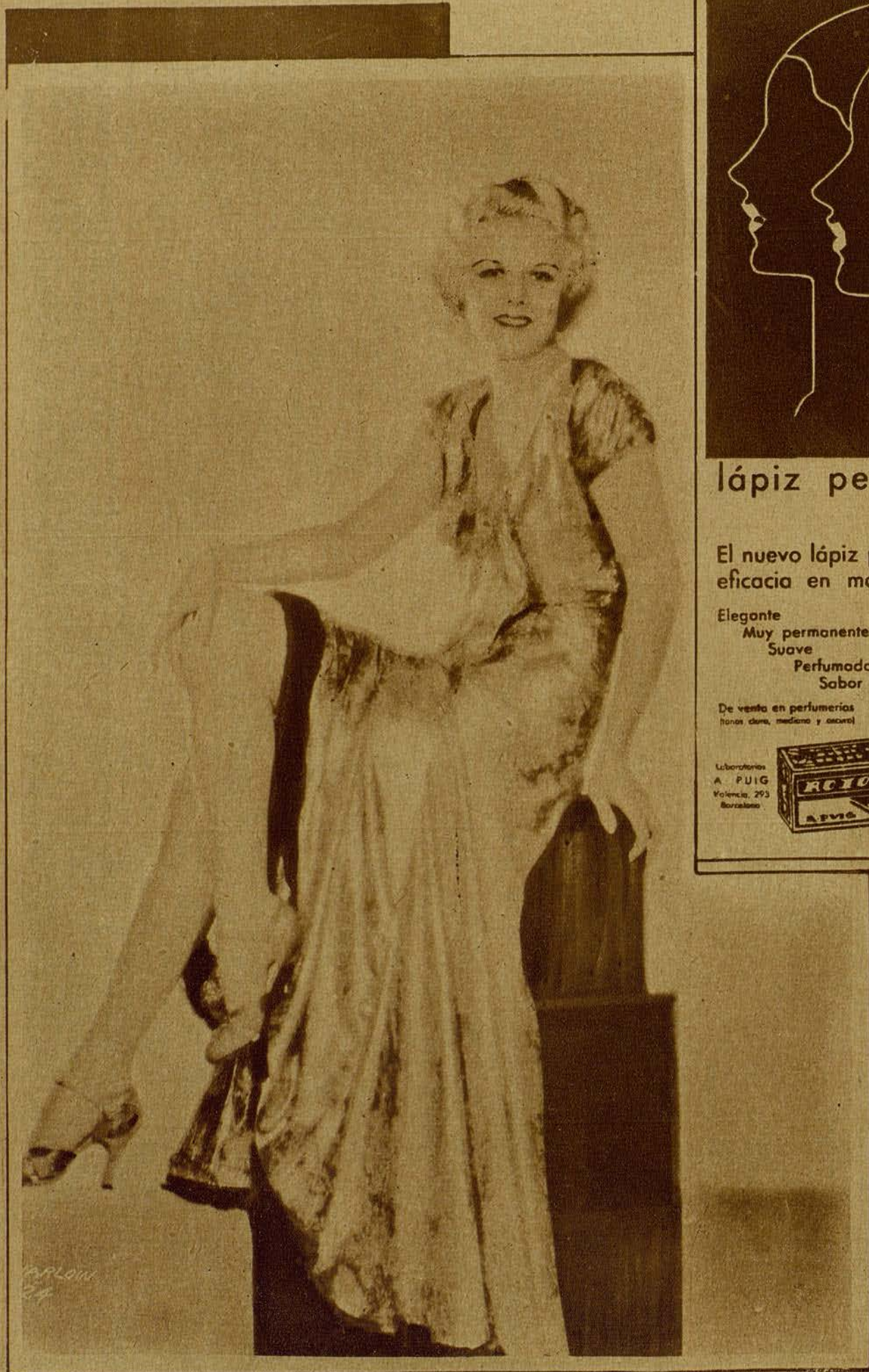
Jean Harlow, protagonista de la producción Columbia, «Abismos de Pasión»