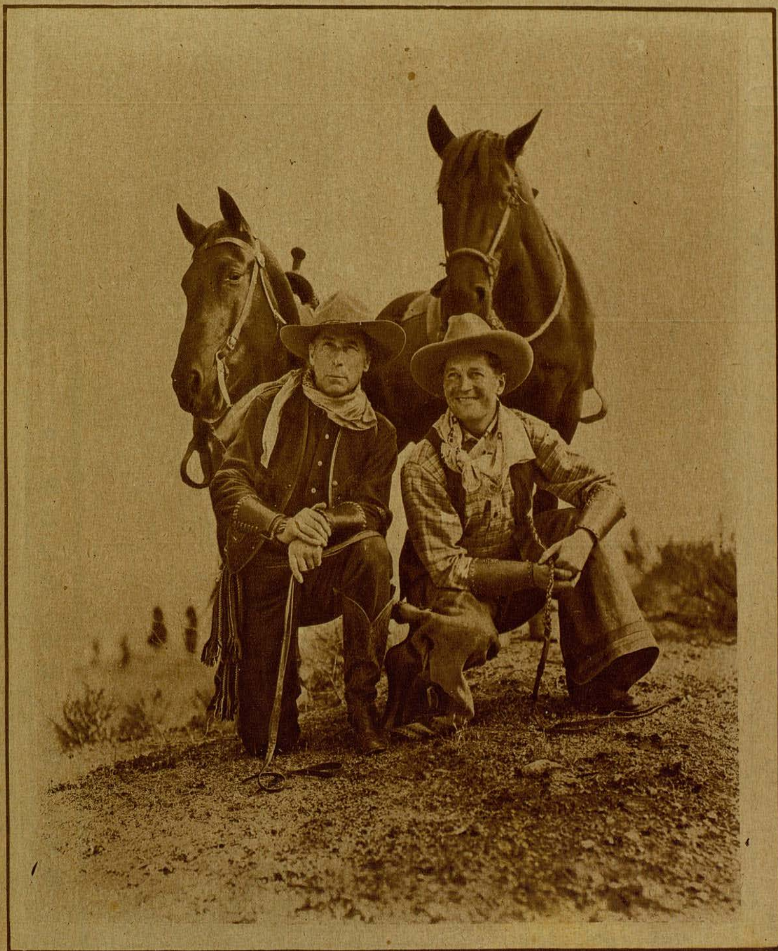
Mauricio Chevalier, acompañado del antiguo idolo del cinema mudo, William S. Hart, en el rancho que cerca de Hollywood posee este último