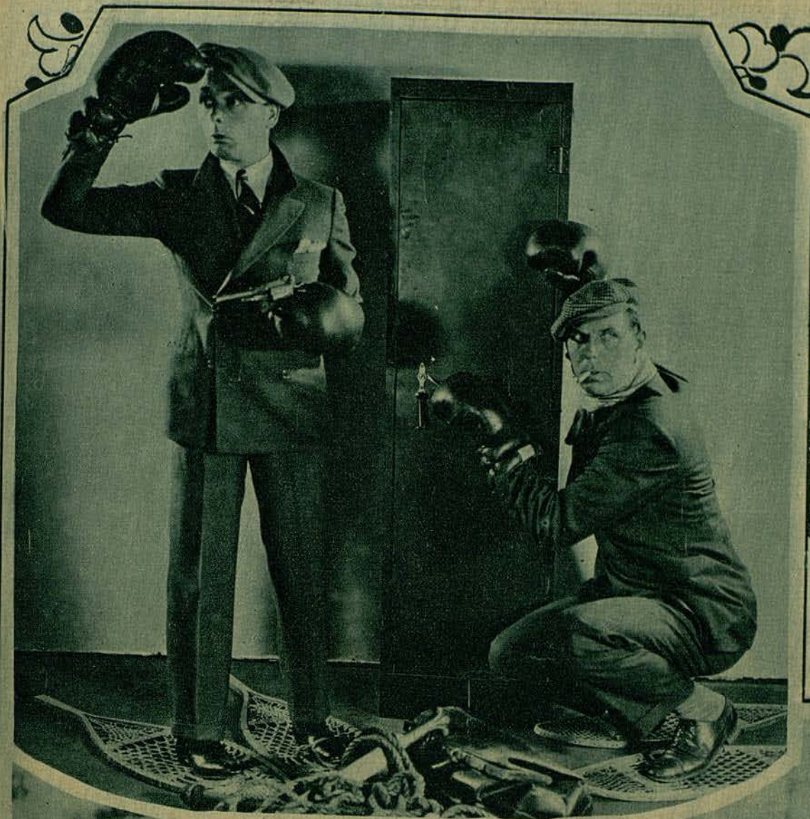
Los actores cómicos de la M. G. M. George K. Arthur y Karl Dane, en una escena de una comedia de ladrones...