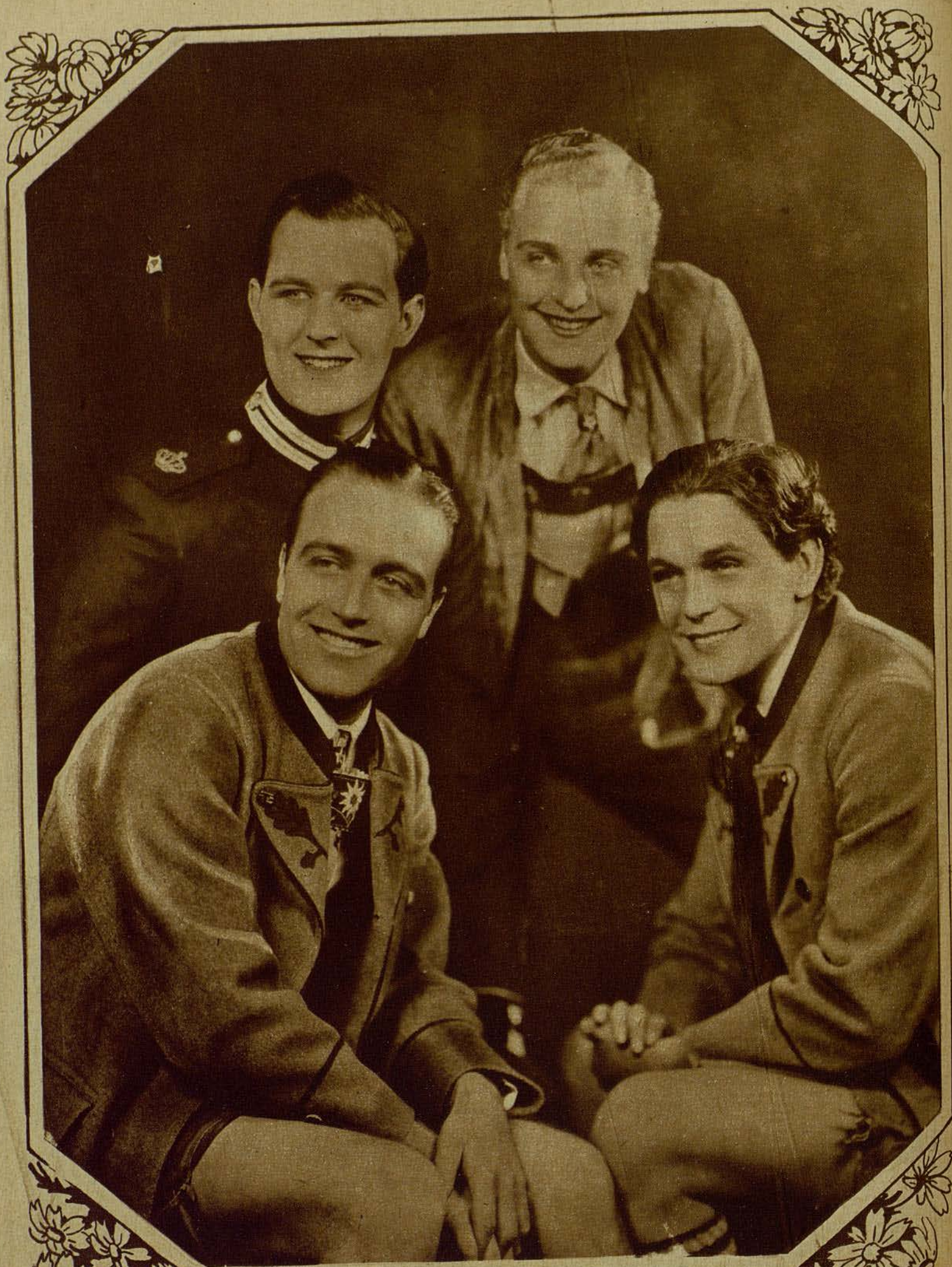
En «Cuatro Hijos», de Film Titan Fox, Margaret Mann desempeña el papel de madre, y son sus hijos James Hall, Charles Morton, Francis X. Bushman y George Meeker