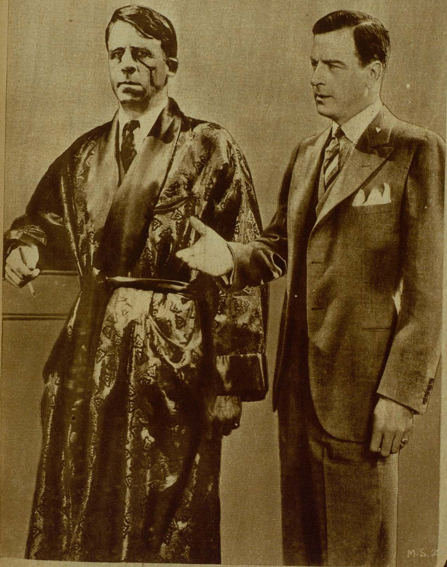
Una doble caracterización del actor de la First, Milton Sills, interprete de la magna producción de la misma marca «El Valle de los Gigantes»