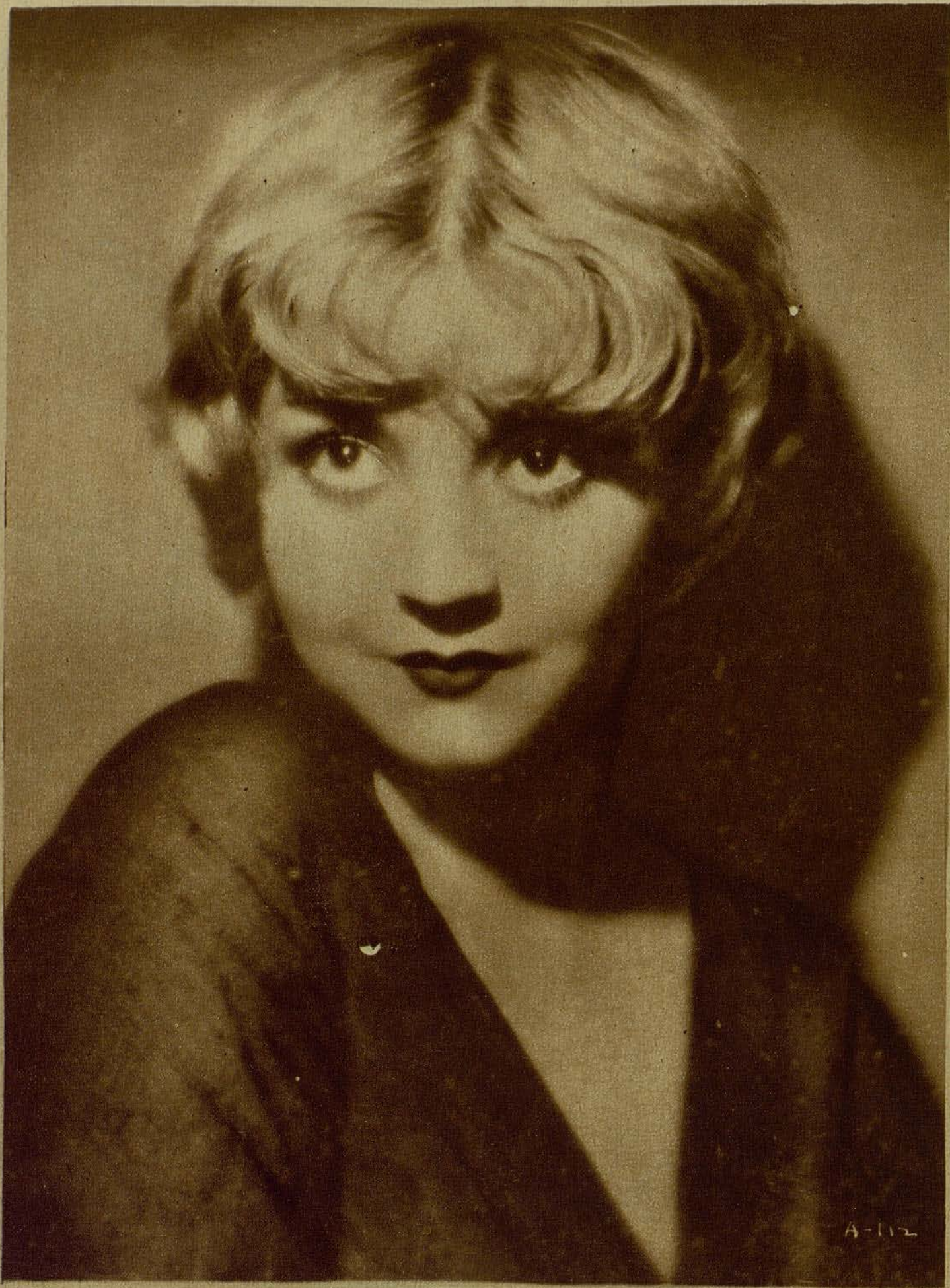
Alice White, elevada a la categoría de estrella por la First National Pictures, y que aparecerá en cuatro películas de la compañía en la próxima temporada