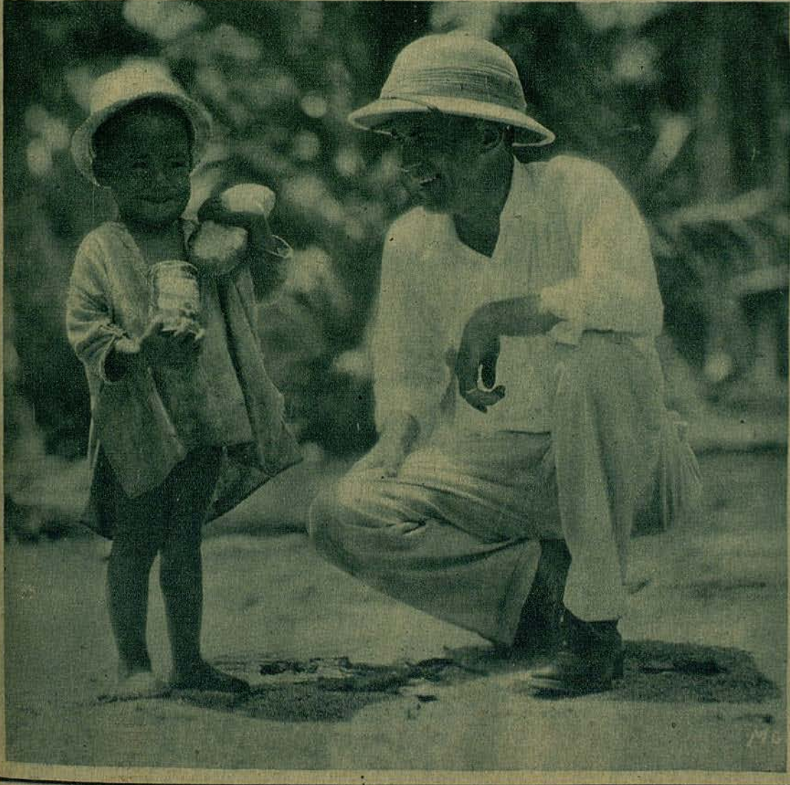
El descubrimiento de Robert Flaherty, director de la M. G. M., en Tahiti descubrió una estrella, la cual aparece empujando su jornal del día: una lata de salmón y pan blanco.