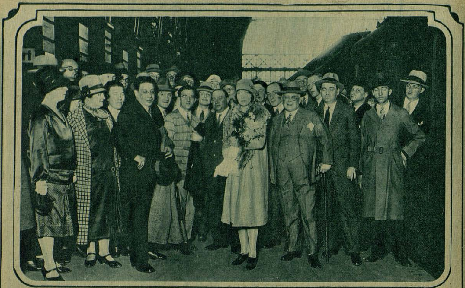
Llegada a Berlín de la célebre estrella americana Lillian Gish