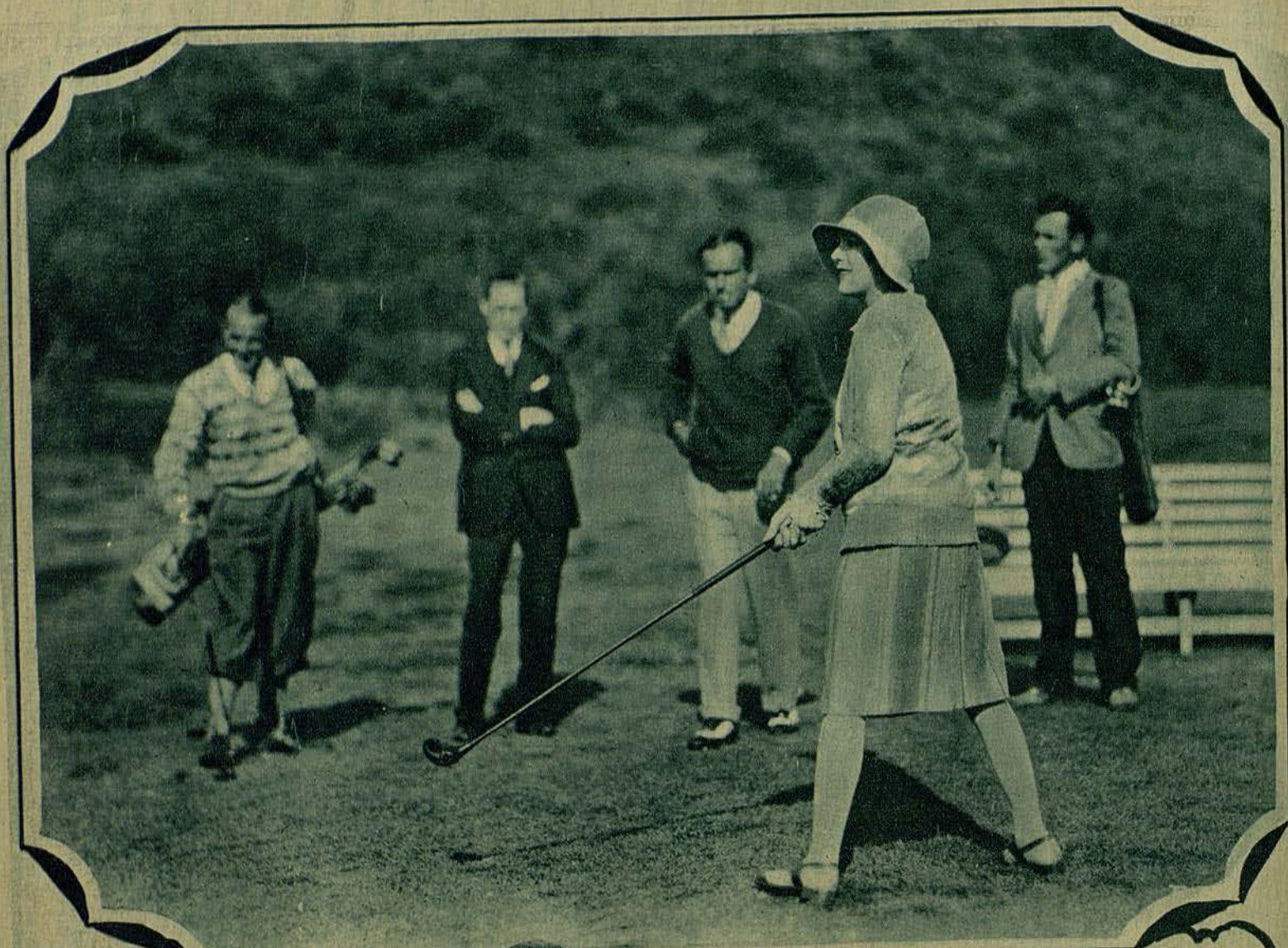
Mary Pickford demuestra su destreza en el golf, en el Riviera Golf Club, de California