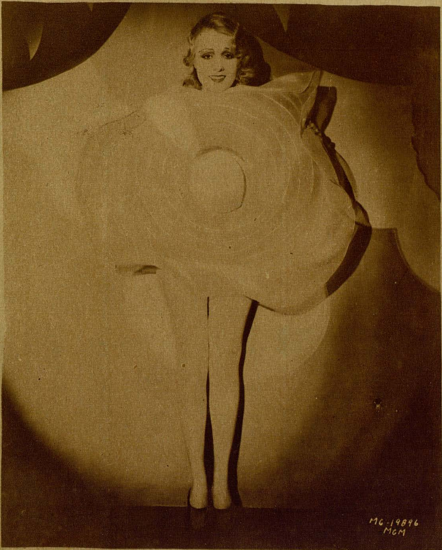
Anita Page, la más linda de las actrices de la M. G. M., en una actitud particularmente encantadora, que real- za sus rubias gracias