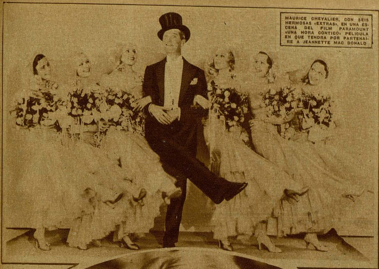
MAURICE CHEVALIER, CON SEIS HERMOSAS «EXTRAS», EN UNA ESCENA DEL FILM PARAMOUNT «UNA HORA CONTIGO» PELICULA EN QUE TENDRA POR PARTENAI-RE A JEANNETTE MAC DONALD