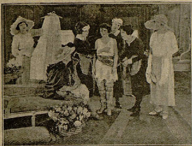
Una escena de «La Fuga de la Novia»

Las dos grandes exclusivas "Metro" que «SELECCIONES CAPITOLIO» ha contratado de estreno en el KURSAAL