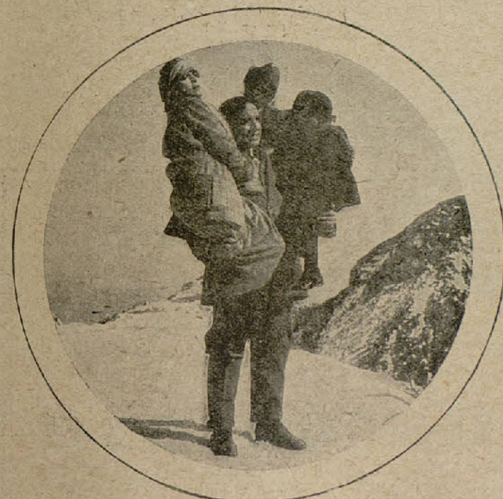
Maciste, el de los músculos de acero, levanta entre sus brazos, sin esfuerzo aparente a tres personas

En el Salón Cataluña ha tenido lugar la prueba privada de la comedia «La lucha con el peligro», interpretación de Luciano Albertini. Tiene esta película un asunto que desde las primeras escenas se hace interesante, estando bien construido para dar margen a situaciones