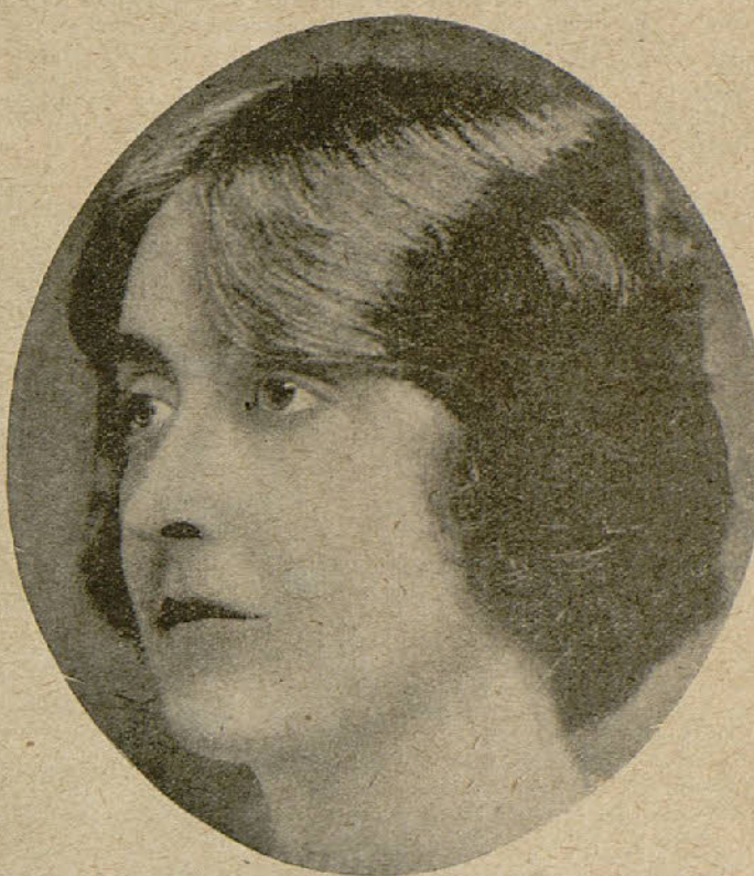
Clara Kimball, la excelente actriz americana, protagonista de algunas películas recientemente estrenadas con aplausos.

Ha llegado a Santa Cruz de Tenerife una troupe de artistas de la manufactura alemana