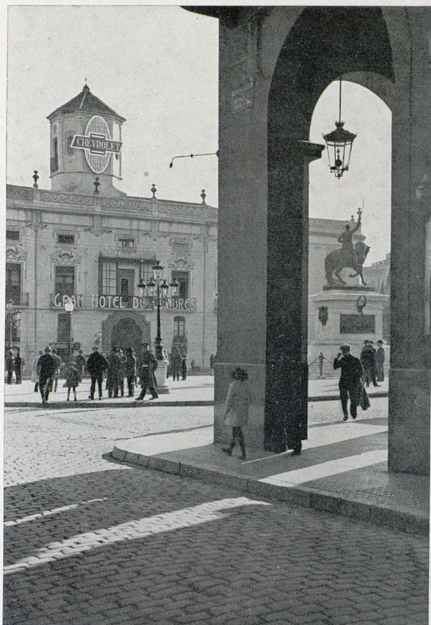
ENTRAN A LA PLAÇA Del último Concurso del «Centre de Lectura» de Reus