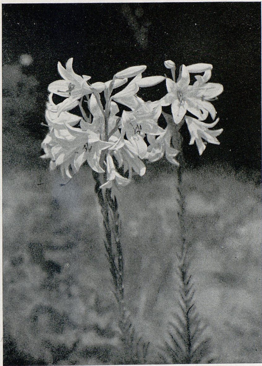
GAYA FLORIDA Del último Concurso del «Centre de Lectura» de Reus