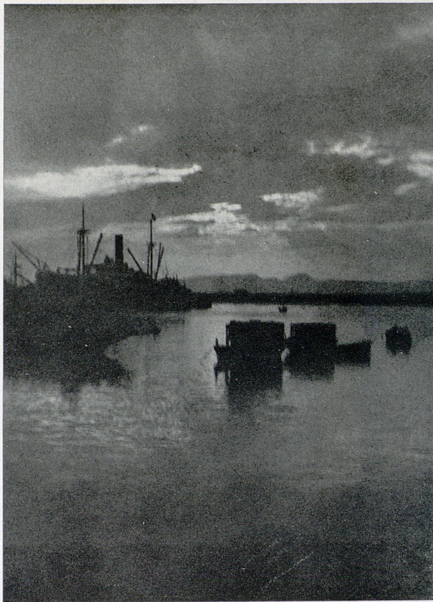
Del último Concurso del «Centre de Lectura» de Reus