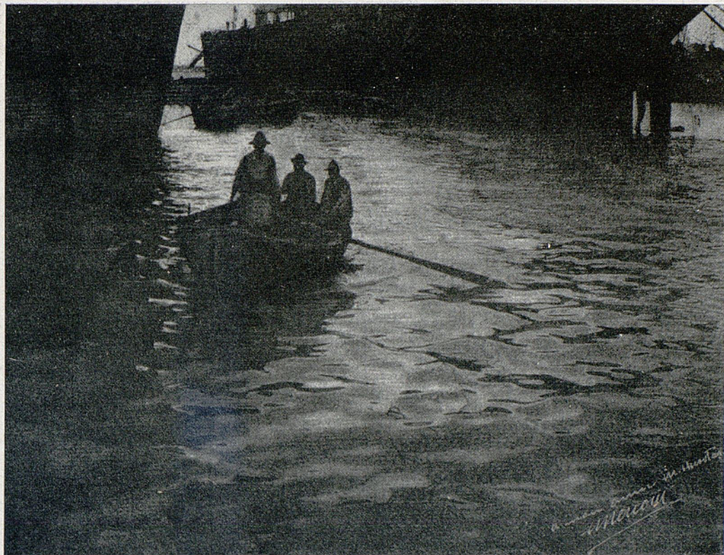
Goma bicromatada Del homenaje a don Miguel Huertas