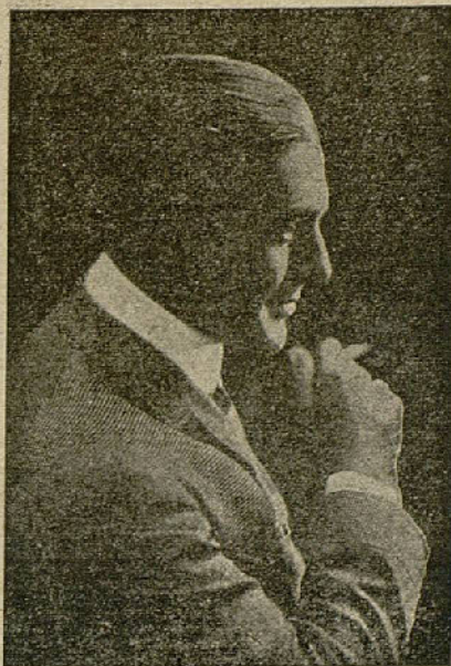
† WALLACE REID

conformidad en desempeñar cualquier papel, por modesto que fuese, pronto le colocó en primera fila entre los actores más notables del día. En ocasiones, Reid no sólo actuaba ante el objetivo cinematográfico, sino que también se encargaba de la dirección de la impresión de la película,