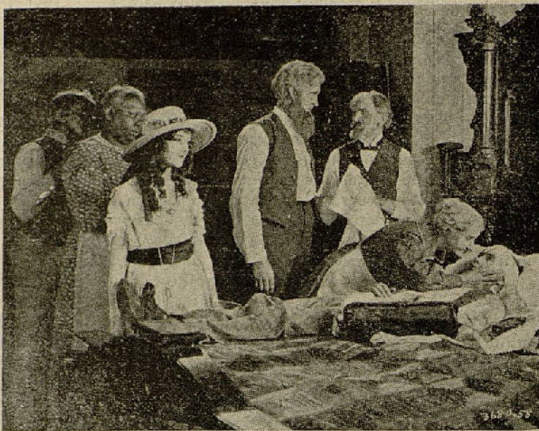
Una escena de la película «Corazones humanos»

Las dos herederas. — Frente a frente los enemigos de una y otra banda, se en-