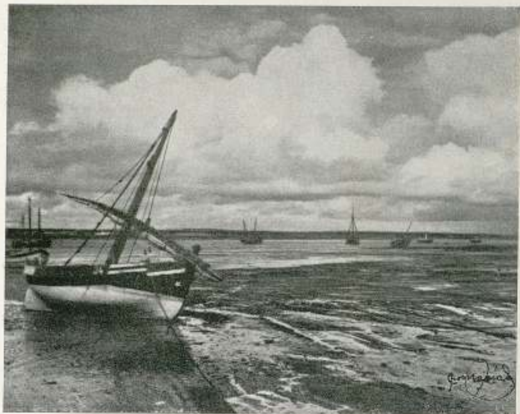
ESTEROS DEL ODRE