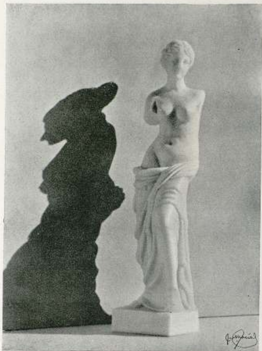
CAUSA Y EFECTO