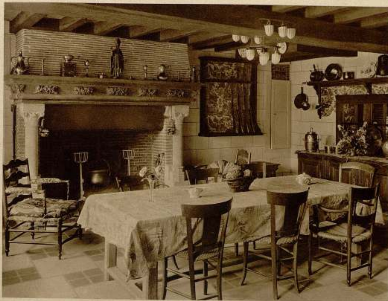
SALLE A MANGER RUSTIQUE

Negatif sur plaque S. E. Orthochromatique sans écran et anti-halo LUMIERE