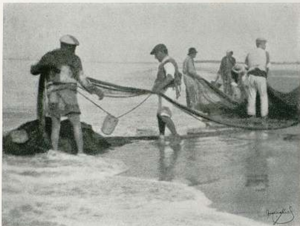
PESCADORES DE PORTIL