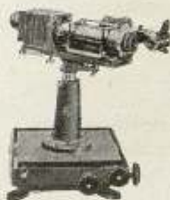
Fig. 9. - Oftalmoscopio fotográfico

Constituyen este instrumento dos sistemas ópticos, uno para iluminar y otro para ver y fotografiar. La fuente luminosa está constituida por un pequeño arco de carbones con 4 ó 5 amperios de corriente. El haz luminoso que parte de este foco pasa por una lente condensadora que forma una imagen del arco en el plano del obturador instantáneo de que está provisto el aparato. Después de éste, el rayo se refleja en ángulo recto en un prisma, y converge rápidamente a través de una lente esférica aplanática, que puede ajustarse para obtener imágenes más o menos grandes del fondo