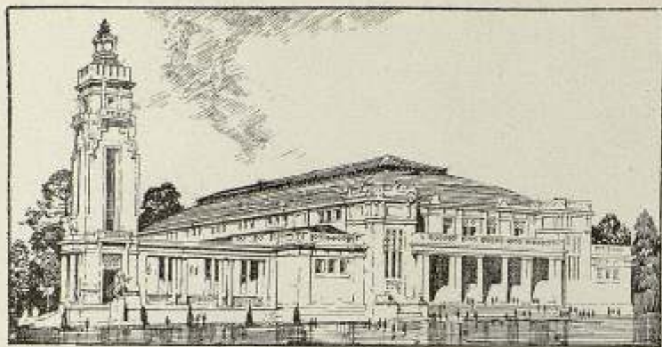
Palacio de proyecciones

tivo, Sección de fotografía artística, industrial y profesional, fotografía documental, de sport, aplicaciones a la astronomía, meteorología, medicina, ciencias naturales, fotomicrografía, radiografía y todos los últimos experimentos científicos.