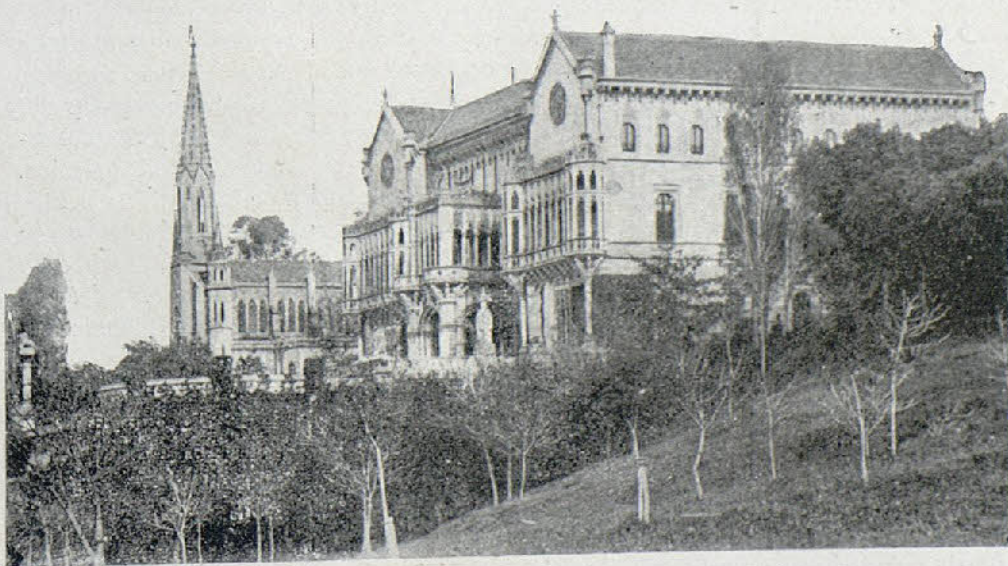
El Palacio gótico del Marqués de Comillas