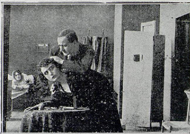
Una escena interesante de la película «Avaricia»

cilio en la Vía Montenapoleone, 28, Milano.