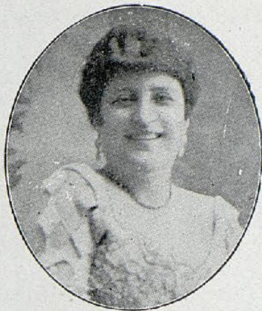
LA VERNA Gentil tonadillera italiana