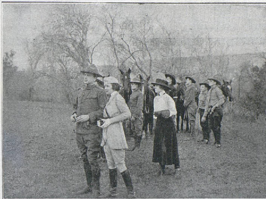
Una escena de la interesante película «La heroína de New-York»

Y, el marqués de Rosicler, entre sollozss, dejando caer su arma al suelo, musitó: