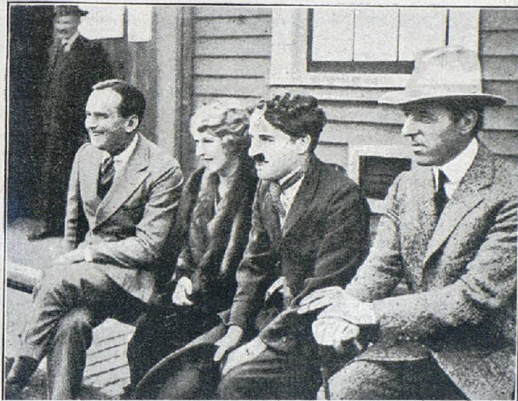
Douglas Fairbanks, Mary Pickford, Charles Chaplin y W. Griffith, después de firmar el contrato por el cual se han organizado por tres años en corporación mercantil

Pero, contra la opinión de los que consideran al Cine como una diversión inferior al teatro y hasta pernicioso (que no faltan gentes que así caractericen al arte mudo) hay que reconocer que existen pocos vehículos de educación y de vulgarización del conocimiento más efectivos y más influyentes, ya que no hay en las aulas ni en los laboratorios medio más directo de alcanzar el cerebro de las muchedumbres que la pantalla cinematográfica.