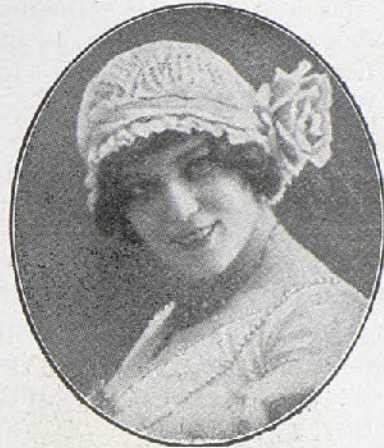
RAQUEL MELLER, célebre cancionista que ha debutado en Eldorado con grandioso éxito