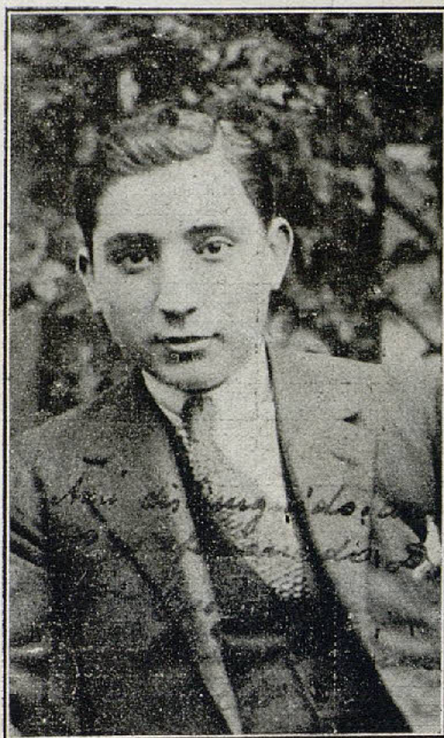
El gran Chicuelo cuya presentación en Sevilla ha constituido un triunfo clamoroso para el prodigioso torero

tocaron dos bichos de esos amaestrados, que dan rabia por lo tontos, de esos que se ven uno cada dos años. Pues el domingo, dos, y los dos a él. Toritos sin respeto en la cabeza, y ya digo, tan tontos, que los hubiera toreado colosalmente el último de los aficionados. Pues