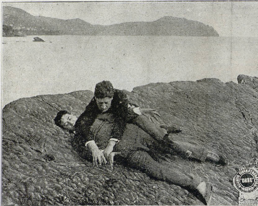
Una escena de la interesante película «La favorita del rey»

También se pasó el primer episodio de la interesante serie en diez episodios, «El misterio de la doble cruz» titulado «La dama del número 7».