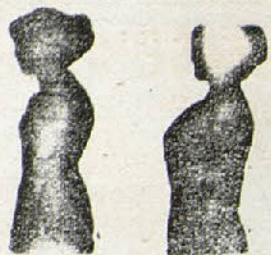
Sin Benefactor Con Benefactor

EXCLUSIVA - TRUST - FILM. - Barcelona: Paseo de Gracia, 59, 1.º, 1.ª; Teléfono 254 G. - Madrid: Atocha, 94; Teléfono 4213 M