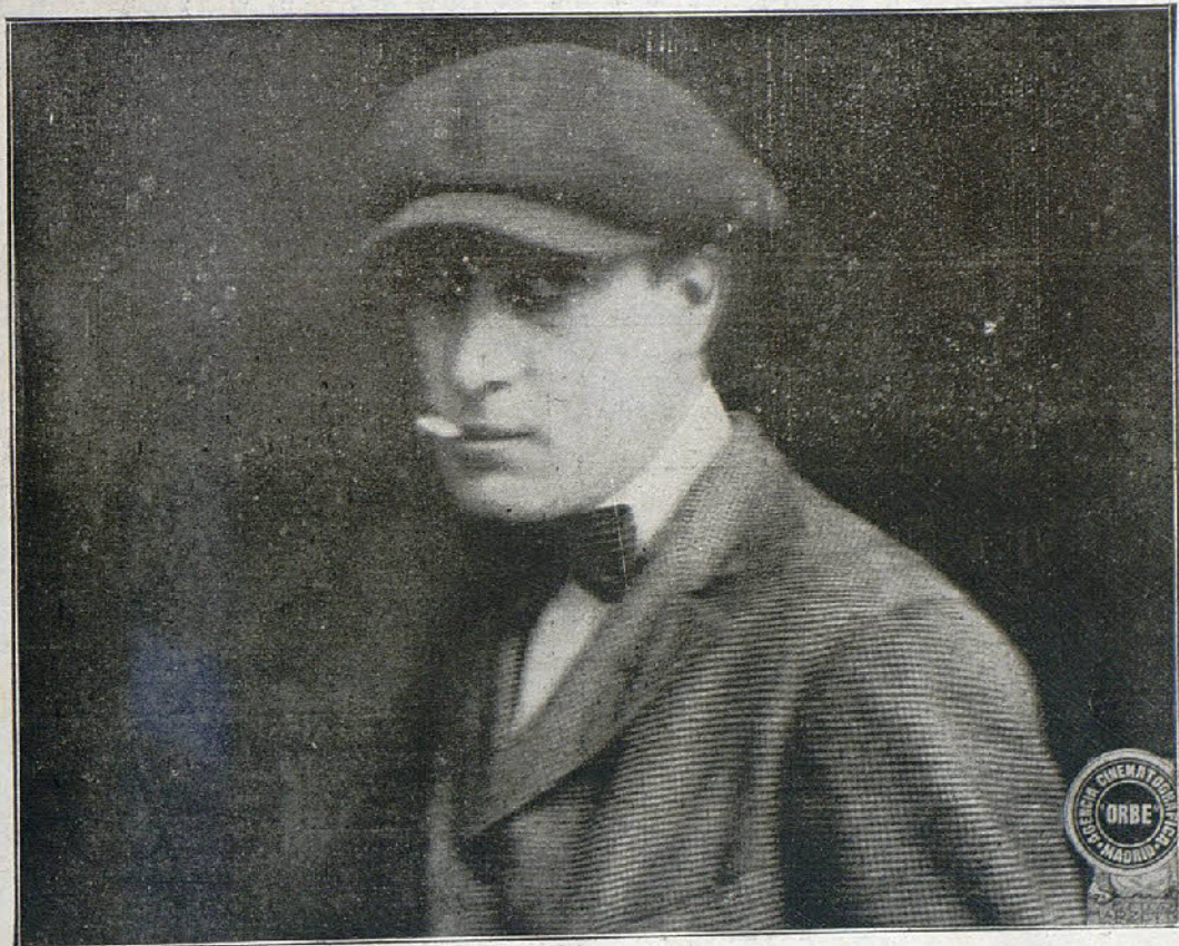
Una escena de la interesante película "La favorita del rey"

La eternidad del amor es una bella mentira de poetas. A los cinco años, el de Lelia y Humberto había sucumbido a manos del hastío, que entró en el hogar por la puerta que le abriera una situación económica insostenible; no era la miseria absoluta, y era algo peor que la miseria misma: la lucha épica por sostener, a los extraños ojos, una ficción de bienestar, en plena decadencia de medios. La casa que antes fuera morada de la felicidad, llenóse de frases hostiles o de silencios hurraños; y el ya agónico esplendor pasado se iba precipitando cada vez más hacia la ruina, impulsado por el conde de Monfiore que confiaba al azar la restauración de su fortuna, y sus últimos restos iban quedando en la mesa de juego del círculo. Si no hubiera sido por Paulina, el ángel inocente que les ataba con un