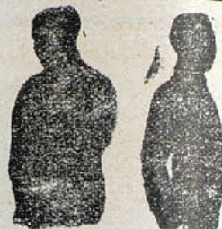
Sin Benefactor Con Benefactor

Para el desarrollo de pechos de las señoras, caballeros y niños :- Indispensable a toda persona que aprecie y practique la higiene en el vestir :- Con el uso del Tirante-Benefactor , las señoras conseguirán el desarrollo de sus senos pudiendo prescindir así de medicinas y unguentos perjudiciales muchas veces a la salud De venta en casa los Sres. Eduardo Schilling, S. en C. (Barcelona-Madrid-Valencia) y al fabricante de Ligas y Tirantes "Smart" AMADOR ALSINA Lladó, 7, pral -BARCELONA--Teléf. A-4851, que mandará folleto gratis a quien lo pida