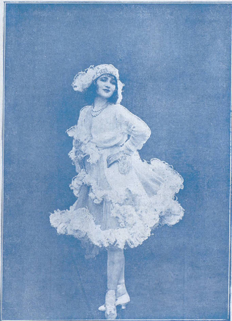
Mlle. Gaby Deslys en una escena de «Bouclette»

Nota. —El famoso solitario de 32 quilates, llamado Mer de Soleil , le fue robado durante una «tournée» en Rusia, en donde acababa de regalárselo el gran duque Diesvaoff. Esta joya fue recuperada en Amberes en el momento en que era presentada para su valoración a uno de los principales mercados de joyas de aquella plaza.