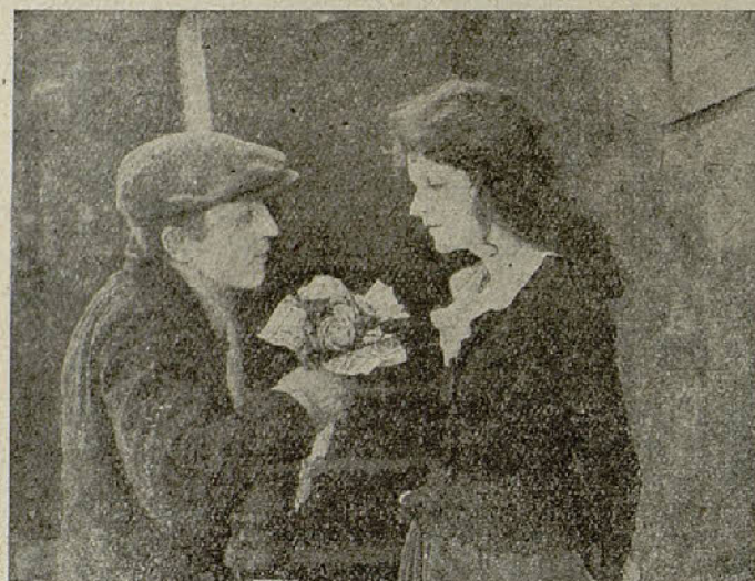
«La calle de los sueños»

«Como se comprenderá — habla mister O'Higgins, — hay que tratar a cada tipo de acuerdo con su particular idiosincrasia. Sería conveniente, sin embargo, que la mujer moderna, para serlo en toda la extensión de la palabra, trocarse la mirada lánguida y el movimiento rítmico del «shimmy», por un