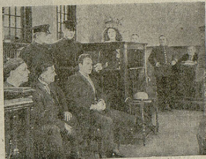
«La calle de los sueños»

Para ayudar al organismo en los casos de depresión y combatir con éxito