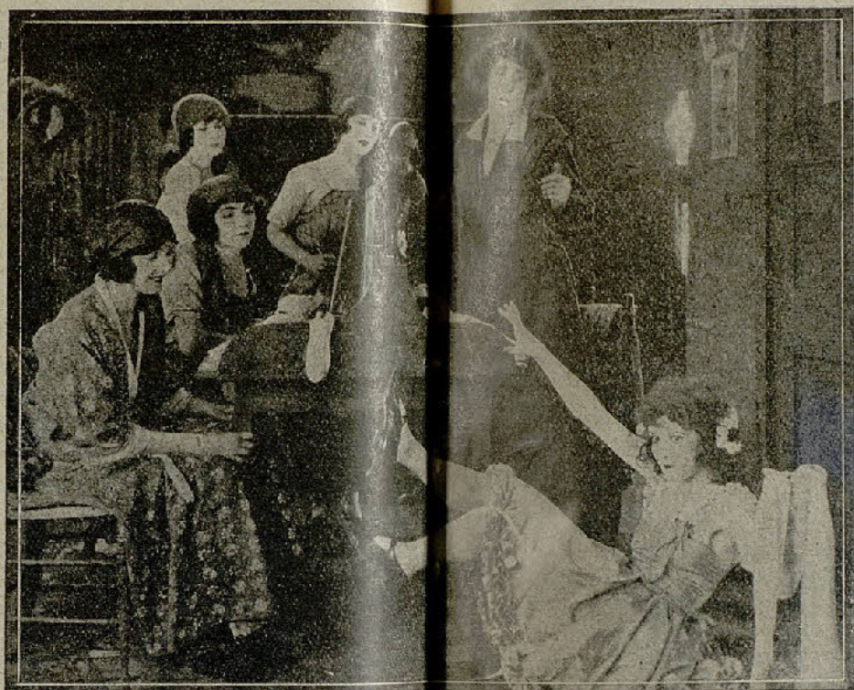
«La calle de los sueños»

Pos las pantallas de los favorecidos coliseos Cine Ideal y Royalty, desfilaron películas de gran valía; «Los heroicos regulares de Gonzalez Tablas», reportaje cinematográfico, cuyo estreno se anunció en el Teatro Eslava, pero que por causas desconocidas no llegó a verificarse «Cinco mil dólares a la hora», por Hale Hamilton y Lucile Lee Stewart, «La pequeña hada de Irlanda», linda comedia de la rubia y bella estrella yanqui Mary Miles Minter, «La pequeña vagabunda», por Shirley Mason y «La deuda satisfecha», de la Universal.