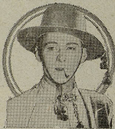
« Los cuatro jinetes del Apocalipsis »

Nosotros recibimos muy pocas cartas porque nosotros tenemos el vicio de contestar a una mínima parte de esas poquísimas que nos trae el correo. Claro es que el defecto de no escribir cartas no tiene una significación de falta de consideración personal hacia los que nos