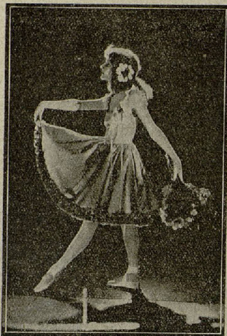
Mary Pickford en «La calle de los sueños»

na al estampido del cañón, y criado entre la metralla de Fleurus, prefería a los azares de la guerra la vida ociosa de París alegre, y su madre lo disculpaba ante el mariscal con un encantador grafismo, hijo de su amor ciego: «¿Es culpa de nadie que él no haya nacido con el corazón velludo y la piel dura como tú?»